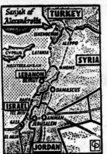
Alexandretta uostas, turkų pavadinimas Iskenderun, yra viena tarp Turkijos ir Sirijos skaudžiausių vietų. Sirija reikiąs pretenzijų į Alexandrettos rajoną. Jau 400 metų, kai Sirija tą sritį savinasi, tvirtindama, kad jokie žemėlapiai nerodo tą sritį priklausantį Turkijai. (INS)

REUTLINGEN, Vokietija. — Tik ką išėjusiame laisvosios Eltos biuletenyje vokiečių kalba gausiai pateikiama dokumentinės medžiagos apie padėtį sovietų okupuotoje Lietuvoje. Vokiečiai kalbantys visuomenė supažindinama su sovietinėmis administracijos įstaigomis, su Lietuvos žemės ūkio kolektyvizacijos metodais, su miškų ūkiu, pramonės gamyba, prekybos tinklu, laivininkyste, su skurdžiomis darbininkų gyvenimo sąlygomis, su maisto gaminių kainomis, gyventojų švietimo sistema, su sovietinėmis pastangomis rusinti ir komunistinti kraštą. Išvadoje biuletenis pabrėžia lietuvių tautos valią atgauti laisvę ir šaukiasi laisvojo pasaulio solidarumo.