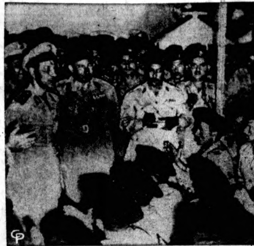
Sirijos armijos štabo viršininkas Afif Bizry (kairėje) kalba į Egipto karių, naujai atvykusių į Damaską sustiprinti Sirijos apsigynimą. Bizry įsakė Sirijos sargybinams būti pasiruošusiems partizaniniam karui, jei Turkija užpuolė Siriją. Turkija pareiškė, kad Sirijos — Turkijos krizė sudaryta Maskvoje.

Įtempimas Viduriniuose padidėjo nuo to laiko, kai Sirija pateko į Sovietų Sąjungos įtaką ir iš jos gavo ginklą. Sirijos skundas prieš Turkiją Jungtinėse Tautose atsirado spalio 18 d., kai ji paprašė, kad Jungtinės Tautos pasiųstų komisiją ištirti Sirijos — Turkijos pasienyje padėtį, kuri, anot jų, graso taikai ir saugumui. Sirija nori, kad ta komisija dešimties dienų laikotarpyje Asamblėjai praneštų apie padėtį.