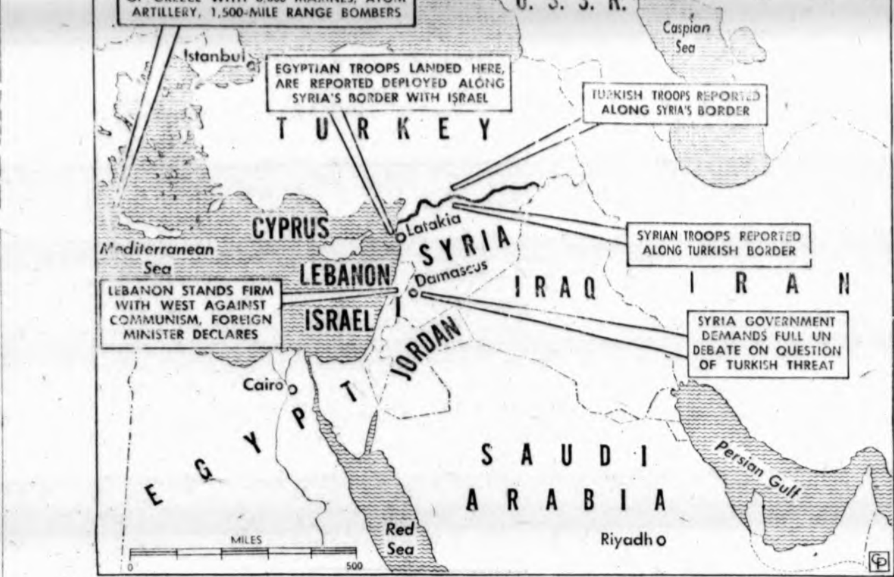
Artimųjų Rytų politinė padėtis. Sirija turinti apie 35,000 vyrų, pašauktų prie ginklų, su 3,000 ar daugiau iš Egipto. Turcija galbūt turi milijoną vyrų karių. Sovietai kaltina, kad 50,000 iš jų sutelkti šiauriniame Sirijos pasienyje, ir kad, girdi, Jungtinių Amerikos Valstijų skatinamos Turcijai pulti Siriją.

Fox Hill Country Club pasakiai gražiose patalpose 8 val. rinkosi visi kvietieji. Puošni publika savo įvairumu bei am-