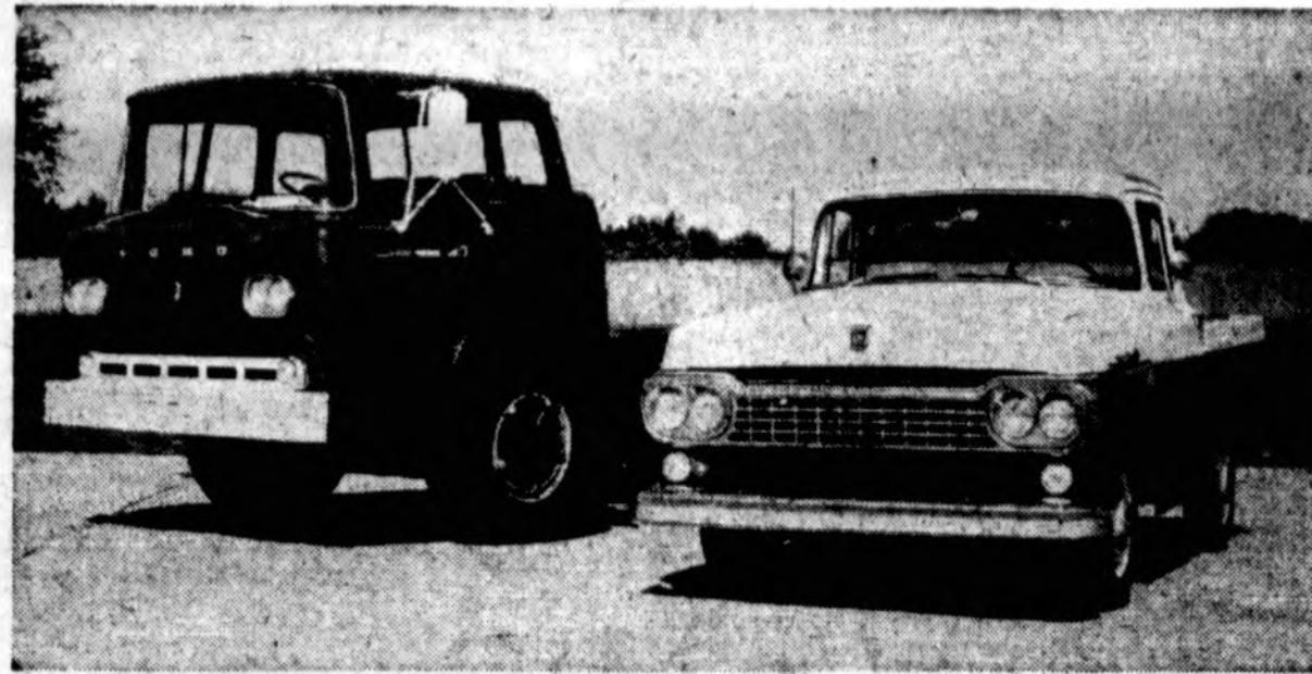
Praeitais metais Fordo sunkvežimiai buvo labai plačiai išparduoti. Čia šiame vaizde matyti ateinančių metų (1958) modeliai Fordo sunkvežimių, kuriems duota daug daugiau puošnumo ir kitokių patobulinimų. Fordo sunkvežimiai yra pažangiausi modeliai visų sunkvežimių išdirbystės istorijoje. Jei jums reik sunkvežimių pramėje, neprikitę kitokio sunkvežimio nematę Fordo sunkvežimį. (Skelb.)