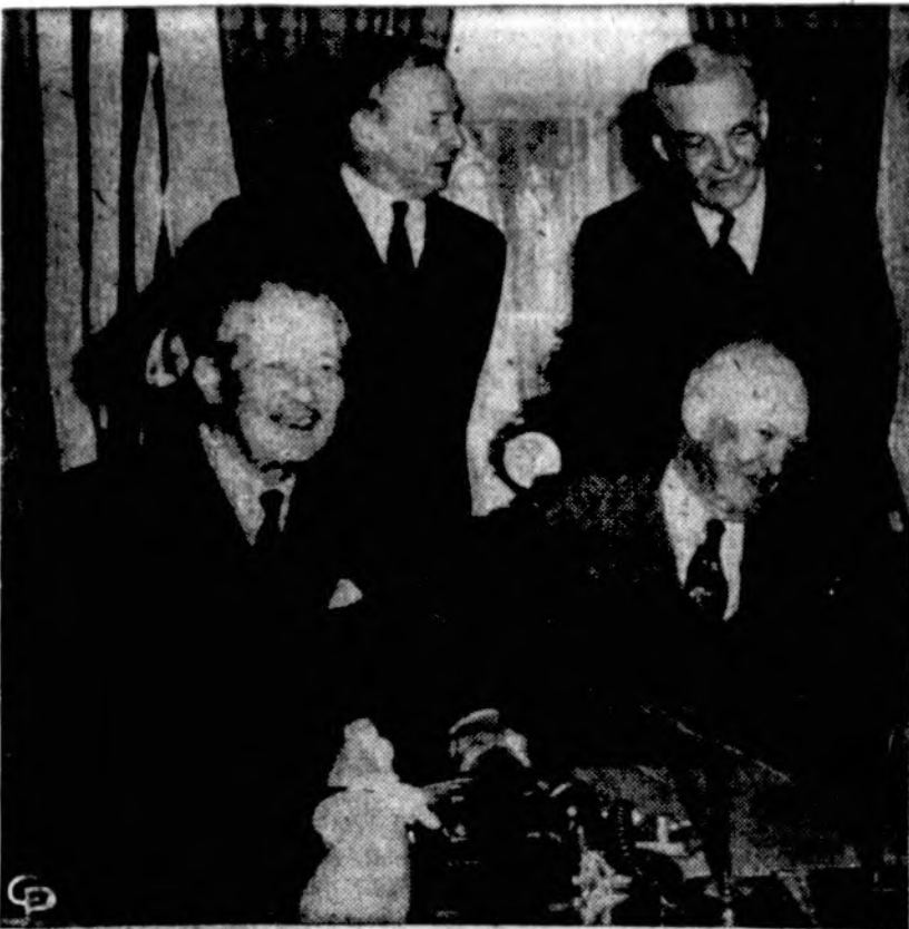
Prez. Eisenhower ir Macmillan, Britanijos min. pirm., kalbėjosi pasaulio saugumo reikalais. Su jais stovi britų užsienio reikalų ministeris Lloyd ir JAV sekretorius Dulles.