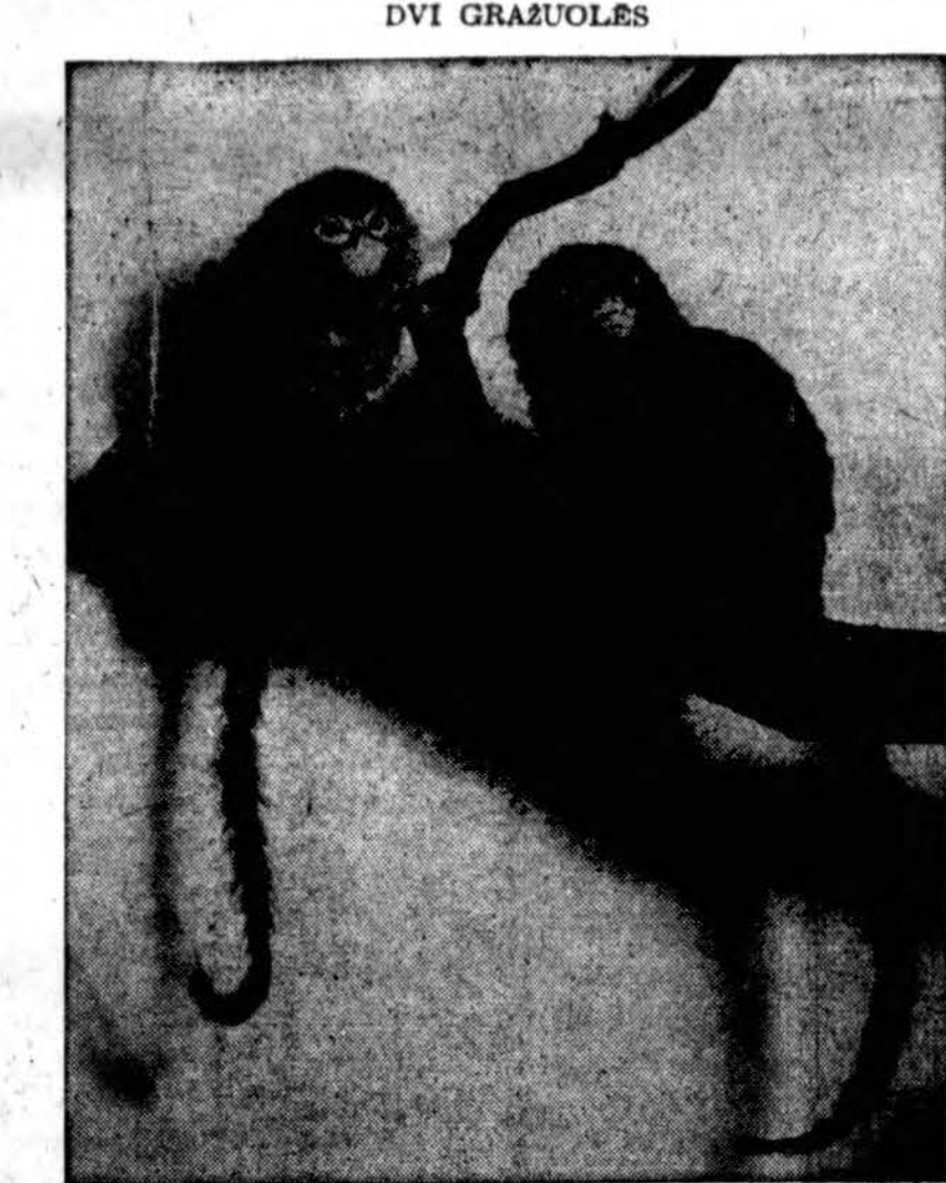
Tom ir Tina beždionikės yra išrinktos lapkričio mėnesio žvėreliais Lincoln Parko zoologijos sode. Tos mažos beždionikės į zoologijos sodą atgabentos praėjusią vasarą iš Pietų Amerikos.