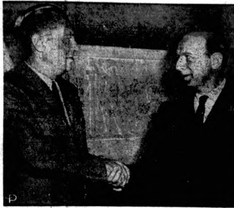
William P. Rogers (kairėje) sveikina JAV generalinį tarytoją Herbert Brownell, pasitraukiantį iš tarytojų pareigų. Jo vieton paskirtas p. Rogers.

● Islandijos parlamento pirmininku išrinktas komunistas.