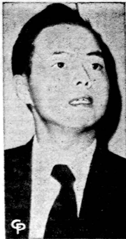
Nobelio fizikas — prof. Tsung Dao Lee, 30 metų. Kinijoje gimęs Columbia universiteto mokslininkas gavo 1951 metų Nobelio fizikos premiją. Taip pat Nobelio fizikos premija kartu su juo gavo Chen Ning Yang, Princeton profesorius. Premija yra apie $40,000.

• Irako princas Abdul Ilah vizituoja nacionalistinę Kiniją. Irako princas vakar atvyko į Taipei, Formozos sostinę.