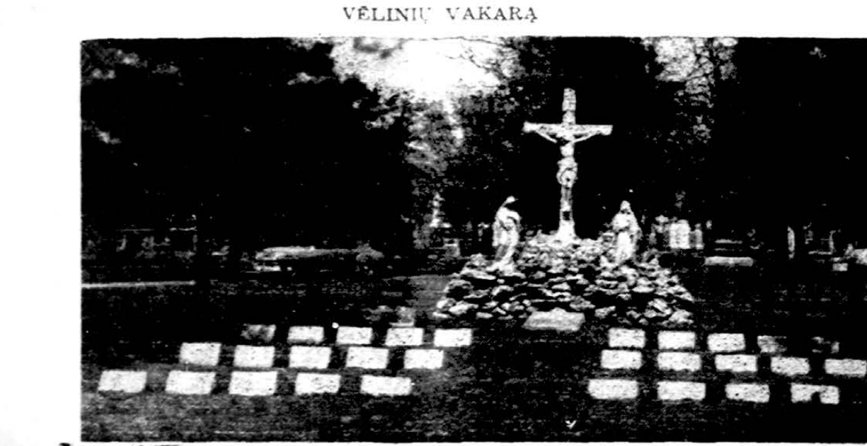
Šiandien vėlinės, mirusiųjų atminimo diena, primenantį šios žemės kelionės laikinumą. Nuotraukoj matyti seselių kapai Sv. Kazimiero kapinėse, Chicagoj.