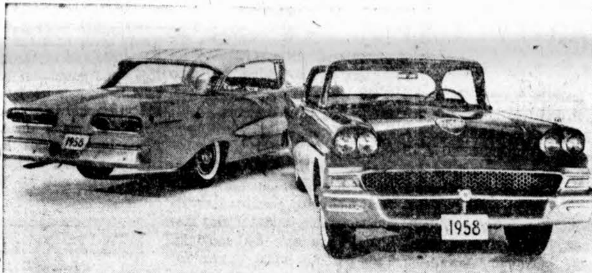
Cia matomi dideli naujų 1958 m. Fordo linijų paketai. Fairlane 500 Town Victoria (dešinėje) ir Fairlane Club Victoria (kairėje) Fordai, tarp kitų žymių pakeitimų turi naujas dvigubas lempas, nerūdijantį aliuminų "grilę", elektrinę jėga pakeliamą motoro dangtį, Cruise-O-Matic trasmitciją bei, pagedaujant, "Ford-Aire suspension".