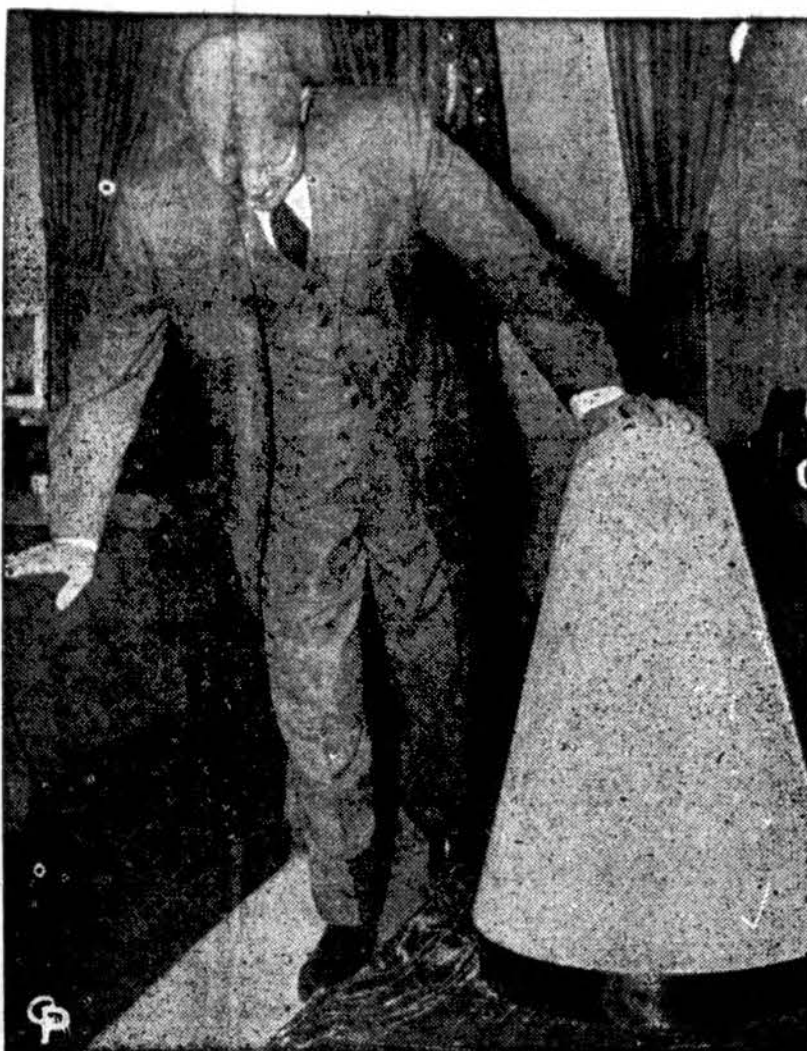
Prezidentas Eisenhower pasirėmė ant eksperimentinės nosies, kuri buvo paleista šimtus mylių į tolimą erdvę ir gražinta atgal nesudegusi atmosferoje, kai jis sakė kalbą apie JAV pažangą satelitų ir raketų laukuose.

— Viceprezidentas Nixon išvyko atostogų į Miami.