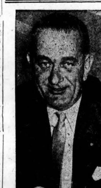
Senatorius Lyndon Johnson (D. Texas), senato demokratų vėdas ir senato pasiruošimų pakomitečio pirmininkas, pareiškė Washington'e, kad jo komitetas norės sužinoti, kodėl Sovietų Rusija pralenkė JAV raketų ir žemės satelitų gamyboje.