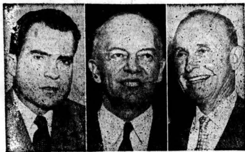
Richard M. Nixon Harold E. Stassen Alfred M. Gruenther Iki parinkimas Respublikonų partija turi „tris šaunius pasirinkimus“ prezidentiniam nominavimui, prezidentas Eisenhower pasakė politikams. Čia yra jų nuotraukos: viceprezidentas Nixon, Gruenther, vadovaujantis Amerikos Raudonajam Kryžiui; Stassen yra Iki „taikos sekretorius“.

Apie New Yorko parengtąjį kvietimą rašė kai kurie vietos laikraščiai, minėdami, kad tokių kvietimų Jungt. Tautų atstovams būvę išsiuntinėta 900.