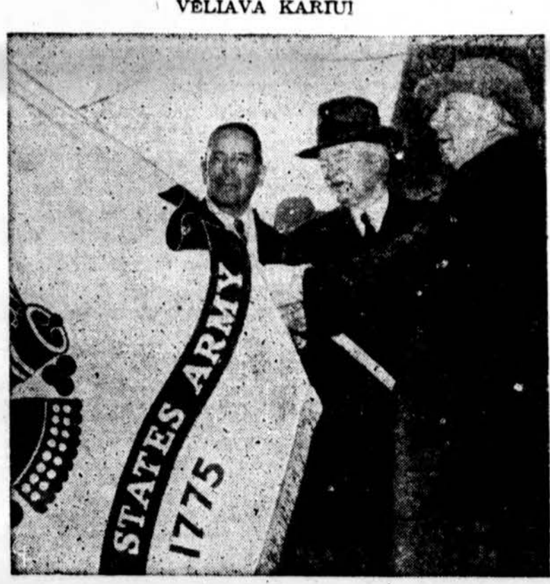
Nauja vėliava senam kariui gen. MacArthur...