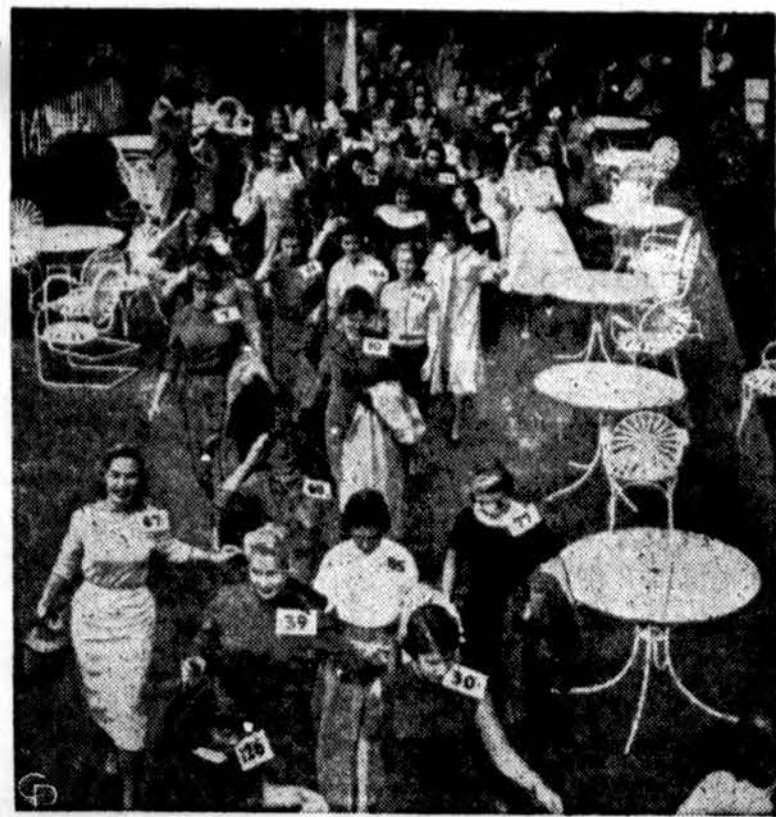
Pasadena, Calif., vyksta kasmet Rožių karalienės rinkimai. Čia matome net 75 kandidates į karalienes.

nebergo universitetinius stovyklus lietuvių kapelinu.