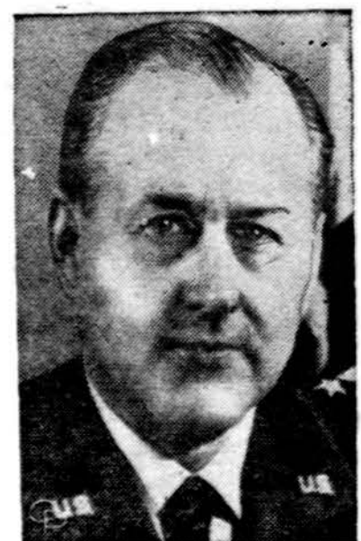
Gen. Thomas S. Power, Nato oro pajėgų viršininkas, pareiškė, kad per 15 min. iš 70 oro bazių lėktuvai gali būti viršum viso pasaulio.

— Indijos premjeras Nehru vakar atšventė 68-tą gimtadienį.