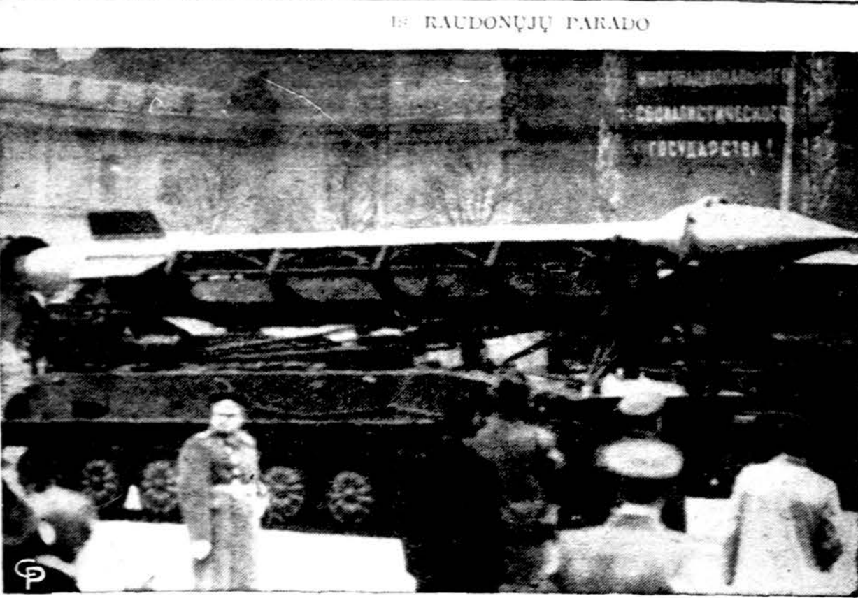
Vaidas iš parado Maskvoje lapkričio 7 d., minint bolševikinės revoliucijos 40 m. sukaktį (INS)

Lapkr. mėn. 16 d. Saležiečių jaunimo stovyklavietėje Šiluvoje įvyksta Chicago vyresniųjų skautų ir jų vadovų pobūvis-vakariėnė.