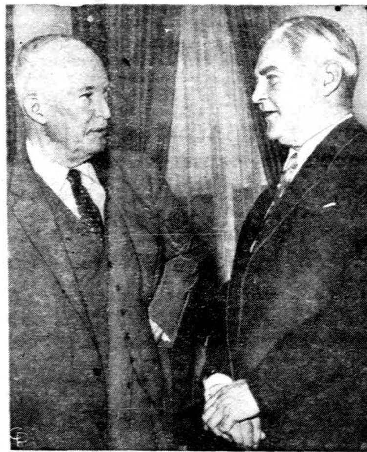
Britų Darbo partijos lyderis Bevan kalbasi su prezidentu Eisenhower Washington, savo vizito metu Amerikoje.

Suslovas buvo anksčiau Pravdos redaktorius, vėliau turėjo keletą didesnių postų kompartijos propagandinėse ir agitacijos įstaigose. Jo įpėdinis Sepilovas vėliau buvo Chruščevio išmestas iš vietos ir patį jos prezidentumo.