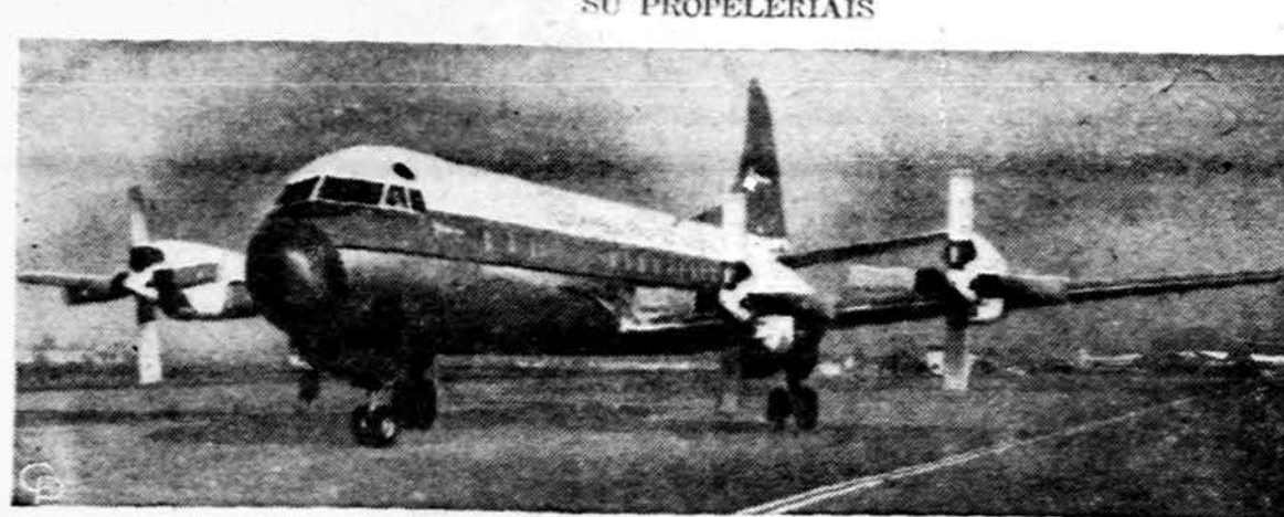
Tai pirmasis JAV sprausmis lėktuvas su propeleriais. Šis lėktuvas gali paimti nuo 66 iki 91 keleivio.