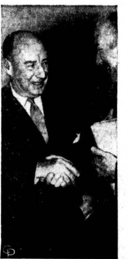
Adlai Stevenson sveikinas su reporteriais Washingtono ir kur jis atvyko pasitarti su Dulles užsienio politikos, Nato, reikalais. (JAV)

LONDONAS, lapkr. 20. — Mažosios Jordanijos karalystė, kaip pranešama iš Vidurinių Rytų braška, kadangi Egipto ir Sirijos kurtomi asmenys labai puola jaunąjį karalių Hussein. Vyks ta neramumai ir vidų. Kai kurie politiniai vienetai spaudžia karalių, kad jis pasektų Siriją ir įeitų į sovietų orbitą. Kairo ir Damasko spauda atvirai kursto Jordaniją išsivaduoti iš Hussein valdžios, gi Kairo radijas atvirai šaukia prie pasikėsinimo ginklu. Ekspertai praneša, kad tokioje situacijoje bėdamas Jordanijos karalius gali būti nuverstas kasdien. Amerikos karinė pagalba stiprina sostą, tačiau yra daug priešų, kurie sako, kad Hussein persidavė užsienio imperialistams. Didelis klausimas ką yra pažadėjęsi Amerika ir Anglija tuo atveju, jeigu kiti arabų kraštai atakuotų Jordaniją.