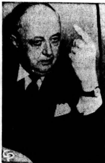
Prancūzijos užsienio reikalų ministeris Pineau atvyko į Ameriką aiškintis dėl Tuniso.

Chicagoje ir jos apylinkėse šiandien truputį šilčiau. Temperatūra arti 40 l. Vėjas ligi 15 mylių per valandą.