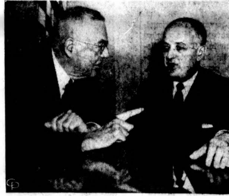
JAV sekr. Dulles ir Prancūzijos užsienio reikalų sekr. Pineau kalbasi Tunisijos reikalais Washingtone, kur pasiekė susitarimo — priimtas toks planas, kad JAV Tunisijai pristatytų ginklai nepatektų į Alžirijos sukiliųjų rankas.

Šiandien nebeturime nei savo valstybės, nei kariuomenės, o tauta neša baisų komunistinį jungą. Ši mūsų tautos nelaimė negali mus įstumti į nusiminimą ir apatiją, bet priešingai — dabar visi lietuviai turi būti kariais ir kovoti už savo tautą; kovoti tokiais ginklais, kokius juos dabar galime turėti. O dabartiniai ginklai yra moraliniai. Mūsų moraliniai ginklai — pilnas tautinis susipratimas. Pilnai susipratę lietuviai savo pareigas tautai atlieka ne žodžiais, o darbais. Šiandien susipratę yra tie lietuviai, kurių šeimose vartojama lietuvių kalba, kurie lanko lietuviškas pamaldas, kurie savo vaikus leidžia ir j lietuviškas šeštadienes ar kitokias mokyklas, kurie pagal išgales aukoja