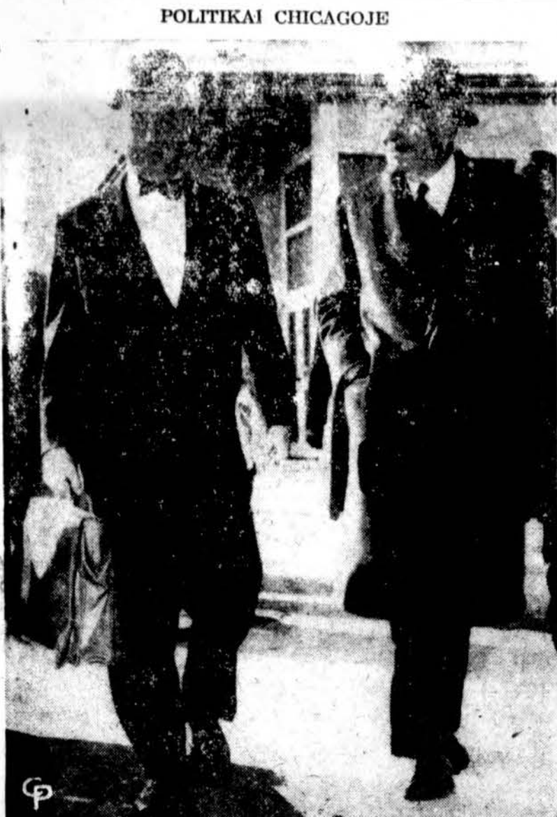
Užsienių reikalų sekr. Dulles ir Adlai Stevenson buvo atvykę į Chicago, kur Dulles pasakė politinę kalbą. Abu politikai tarėsi užsienio politikos, Nato, reikalais.

× "Keleivis", Mažosios Lietuvos lietuvių laikraštis, eina V. Vokietijoje. Jame telpa daug žinių apie prieškarinę ir nūdienę Maž. Lietuvą. Laikraštis mėnesinis, leidžia Mažosios Lietuvos Tėviškės Myletojų draugija. Adresas: Keleivis — Verlag, Luebeck, Vorwercherstr. 103, Haus IV/8, Germany.