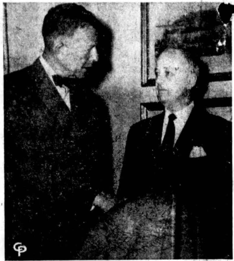
JAV gynybos sekretorius Neil McElroy (kairėje) sveikina Prancūzijos užsienio reikalų ministrą Christian Pineau pradedus dvių valandų konferenciją Washingtono. Atrodo, kad Pineau pritarė Jungtinių Amerikos Valstybių planui dėl vidutinio tolio balistinių raketų bazių Prancūzijoje ir kitose Šiaurės Atlanto Gynybos organizacijos (Nato) valstybėse.

Oro biuras praneša: Chicagoje ir jos apylinkėse šiandien — daliniai apsiniaukę, truputį šilčiau.