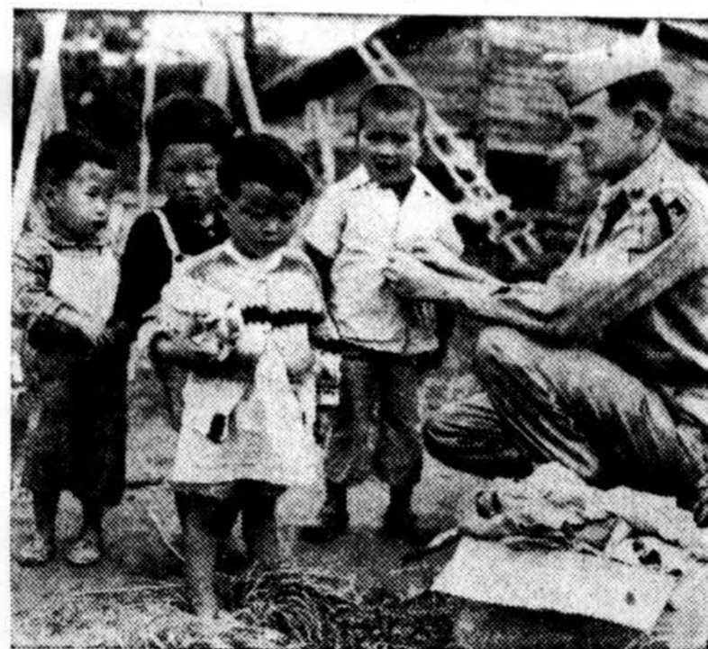
Japonijos našlaičiai džiaugiasi gaudami drabužėlius iš amerikiečių kario. Pasaulyje vargstantiems padėti Amerikos Katalikų Vyskupų fondas daro rinkliavą lapkričio 24-30 dienomis.