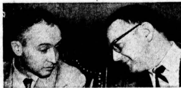
Harry Gold, (kairėje) ir David Greenglass, nuteisti į kalėjimą už šnipinėjimą Sovietų Rusijos naudai, buvo klausinėjami kalėjime JAV senato vidaus saugumo pakomitečio narių, kad sužinotų koki būdu sovietai pralenkė JAV raketų ir satelitų gamyboje. David Greenglass pareiškė, kad Julius Rosenberg satelito atominio lėktuvo ir priešraketinės paslaptis išdavė sovietams po II Pasaulinio karo. David Greenglass ir Harry Gold dabar sėdi Lewisburg kalėjime. Pa. Julij Rosenbergui ir jo žmonai mirties sprendimas už šnipinėjimą sovietams buvo įvykdytas 1953 metais.

JAV apsaugos departamentas įsakė pastatyti 65 milijonų dolerių raketų bazę netoli Cheyenne, Wyo. Ten bus pastovi ilgo tolimo raketų iššovimo bazė. Ten bus išsaunamasi raketos, kurios net galės pasiekti Maskvą, jei būtų reikalingas.