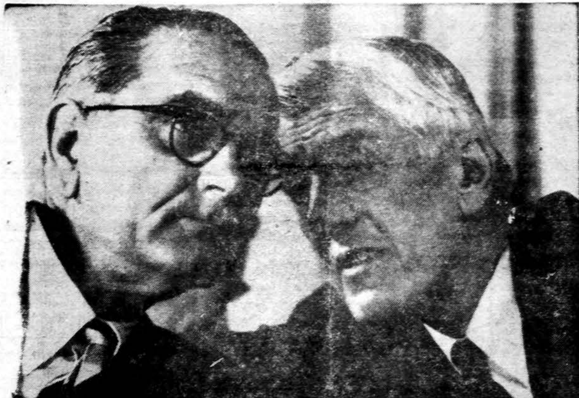
Senatruis Johnson (D. Tex.) (kairėje), Senato pasirošimo pakomitečio pirmininkas, kalbasi su senatoriumi Leverett Saltonstall (R., Mass.), komitetui pradėjus tyrinėti JAV raketų-satelitų programą. Pradėta apklausinėti pirmaeilis mokslininkus, kas atsitiko, kad sovietai pralenkė JAV satelitų ir raketų gamyboje. Dr. Edward Teller, vadamas vandenilio bombos „tėvu“, pareiškė: jei JAV ir Sovietai tokiu pat spartumu darbuosis prieš raketinių ginklų kaip dabar, nėra abejonės, jog mes pasiliksime toli sovietų užpakalyje. Jis gana gerai atsiliepė apie JAV raketinių programų darbą ir vadovavimą. Bet JAV šio darbo greičiai pervelai, kada Sovietai buvo toli pažengę. Dr. Teller naturalizuotas imigrantas iš Vengrijos, mano, jog Sovietai arba jau turi, arba greit turės tobulą tarpkontinentinį raketų, kuriomis pasiektų ir Amerikos pietines teritorijas, pav. Houston, Tex.

Daugelis faktų aiškiai rodo, kad plenumas nutarė perimti iš kariuomenės vadovybės politrukų organizacijos kontrolę ir vidaus saugumo dalinių — MVD teroro ginkluoto pagrindo — vadovavimą. Abu tie organai dabar subordinuoti KGB (valstybės saugumo komitetui ministrų taryboje), kuriam vadovauja ligi šiol dar nelabai žinoma žvaigždė generolas Zerovas. Šis generolas yra pasidaręs savotišku teroro spaudimo reguliatorium. Jis priklauso nuo vyriausybės, į kurią Chruščevs neįeina. Nikita, žinoma, išeidamas iš savo pozicijos, gali paveikti Zerovą ir jį paspausti, tačiau jo potvarkius turi patvirtinti vyriausybė. Chruščevs negali įsakyti Zerovui. Jeigu jis ką ir įsakytų, įsakymas neturi galios, jeigu vyriausybė atsisakytų jo pusi-pasirašyti. Šis formalumai sovietiškoje tikrovėje daug daugiau reiškia, negu apie juos paprastai manoma. Noredamas pasiekti diktatūros, Chruščevs turi taip manevruoti, kad teroro aparatas pereitų į jo rankas, o tai negali įvykti tol, kol jis neatsisės į vyriausybės suolą. Iš to ir eina gandai, kad Nikita stengiasi būti ministrui pirmininkui ir kad Bulganas pakeis pensininką 76 metų Vorosilovą, nors pastarasis