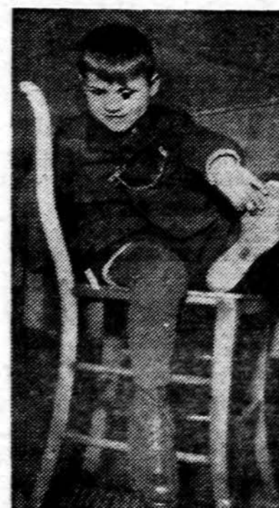
Europietis berniukas džiaugiasi naujais batais, kuriuos jis gavo iš Amerikos Katalikų Vyskypų fondo. Šiais metais Vyskypų fondas draubūžių rinkimo vaitų vykdė nuo lapkričio 24 ligi 30 d.