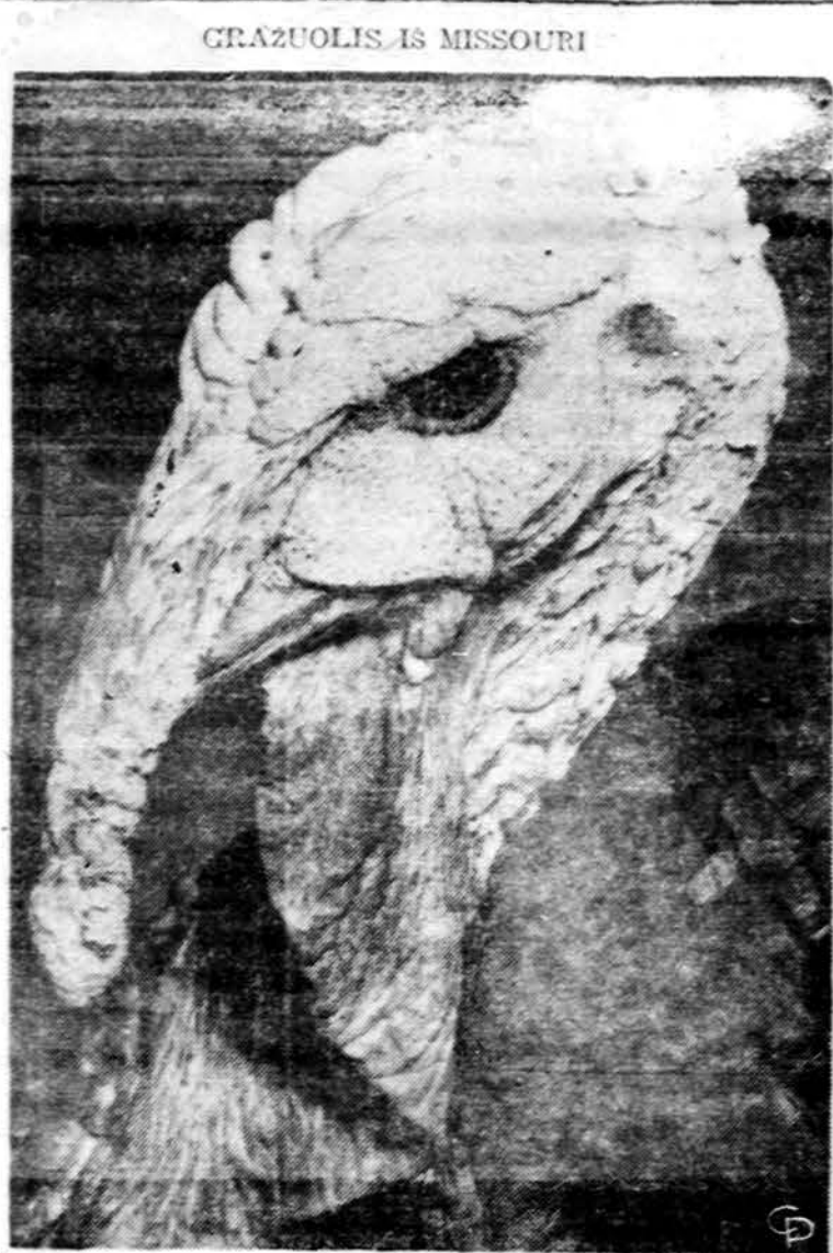
Padėkos dieną kalakutai puošė milijonus statų. Šis gražusis iš Missouri valstybės išdėdžiai stovėję prieš fotografą, nesirūpindamas, kad bus suvalgytas. Gaila, bet taip bus.

Lietuvių R. K. Labdarių sąjungos seimas įvyksta gruodžio 1 d. 2 v. p. p. Senelių Vilo — Holy Family Vila — patalpose, 123 st., Orland Parke, Ill. Kleb. A. Linkus atnašaus šv. mišias 10:30 v. senelių prieglaudos bažnyčioje.