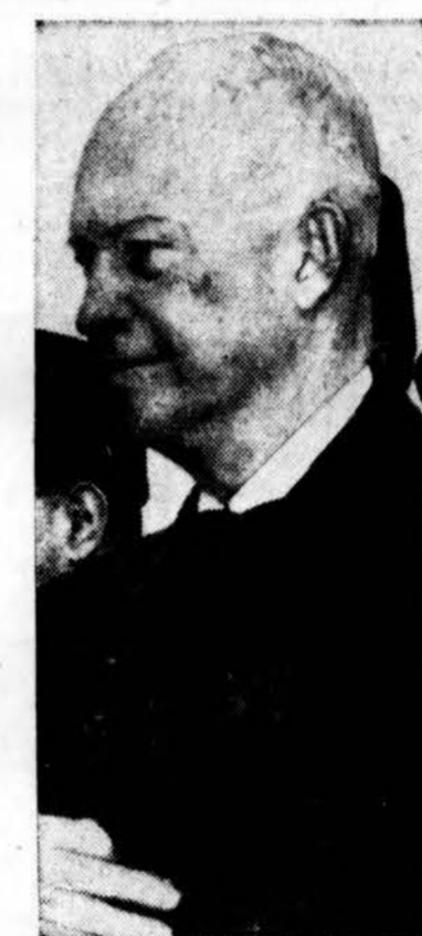
Prezidentas Eisenhoweris, susirgęs praėjusį pirmadienį, šėmingai sveiksta, praneša Baltieji Rūmai. (INS)

ORAS Oro biuras praneša: Chicagoje ir jos apylinkėje šiandien — šilčiau.