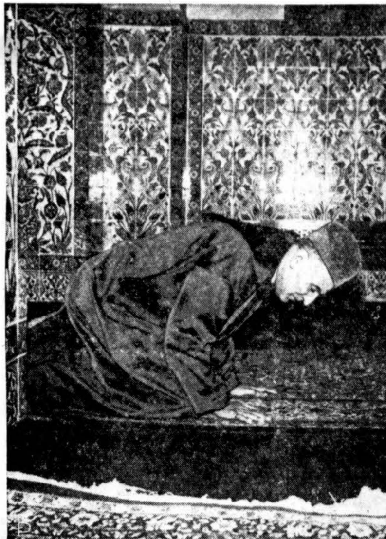
Maroko karalius Mahomedas V klūpi Islamo centre Washingtono. Mahometonai meldžiasi per dieną penkis kartus.

lime būti vieniems dideli geradari, o kitus, tokį patį vargą vargančius, atstumti. Mes negalime ribotis vien tik savo giminių bei draugų šelpimu. Mes privalome šelpti kiekvieną lietuvių, patekusį į vargą. Kam gi ma lonu skaityti tokius graudenimus iš Lietuvos: „Pas mus daug kas gauna dovanų iš Amerikos. Ir aš norėčiau kad jūs, brangūs broliai lietuviai, atsiųstumėte mums dovanų. Turiu septynis vaikus ir vyrą ligonį. Pati esu ligonė ir sergu širdies ligą. Atsiųskite mums vaistų“.