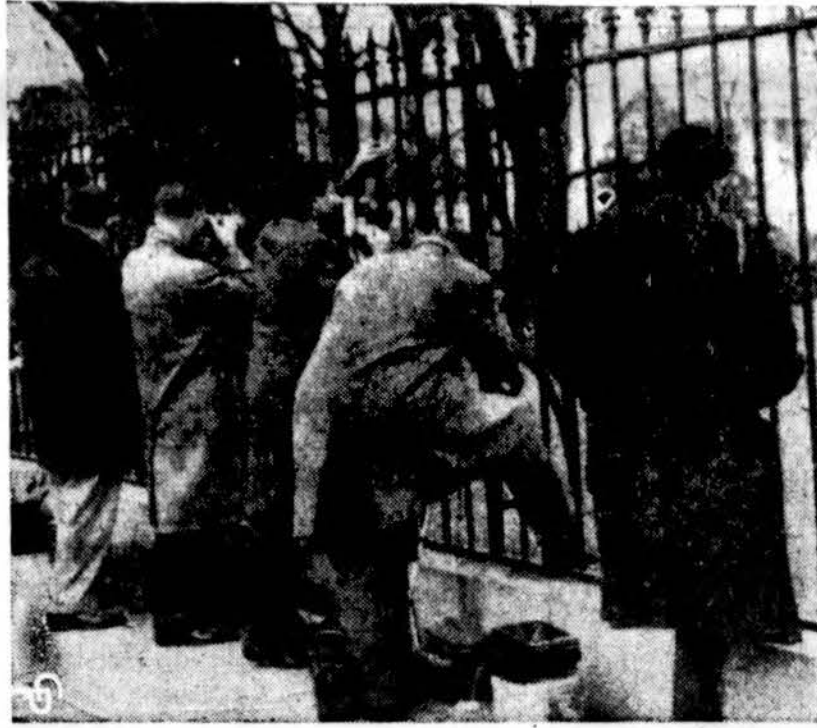
Fotografai ir žurnalistai vaikšto apie tvoras Washingtono, prie Baltųjų Rūmų, norėdami gauti žinių apie prez. Eisenhowerio ligą.

sisavinimas. Logiškai galvo- jant, apylinkės neatlikusios šios pareigos, turėtų nustoti buvę bendruomenės padaliniais. Šitoks nedrausmingumas yra nepaprastai žalingas, nes Vyr. Valdyba nieku negali pasitikėti, ypač didesnio darbo griebiantis.