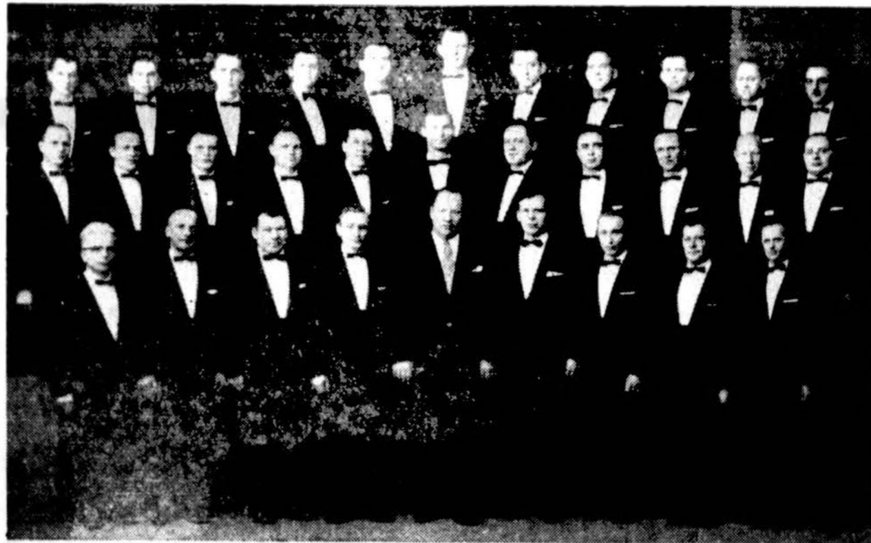
Chicago Vyrų choras kuris stato Rigoletto operą gruodžio 8 d. 30 v. p. p. Marijos Augšt. mokyklos salėje.