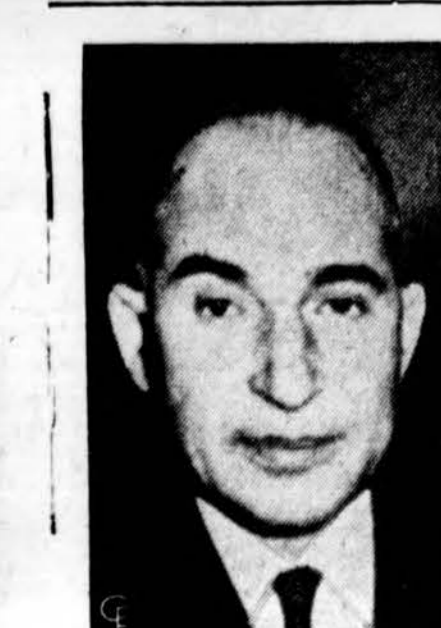
Mahmud Fawzi, Egipto užsienio reikalų ministras, bandas pagerinti diplomatinius santykius tarp Egipto ir Jungtinių Amerikos Valstybių.