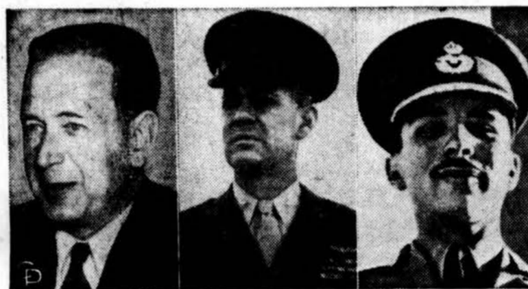
Hammaraskjöld, Colonel Leary, King Hussein

Kapsuko (Marijampolės) dramos teatras (neseniai susikūręs) Vilniuje pastatė Čičiaus keturių veiksmų dramą „Versmė“. Veikalas vaizduojas Suvalkijos valstiečių sukilimą.