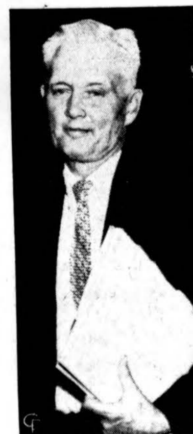
Sherman Adams, prezidento Eisenhowerio patarėjas Baltuosiuose Rūmuose. Prezidentui Eisenhoweriui sergant, Adams patarimai turė didelės įtakos.

Prancūzijoje pakilo pieno ir gazolino kainos.