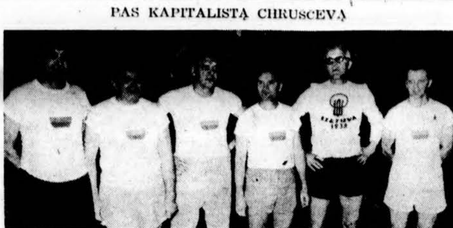
Krepšinio veteranų komanda dalyvavusi Lietuvos krepšinio 20 m. sukakties minėjime Chicagoje.