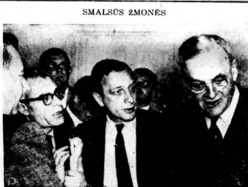
Valstybės sekretorius Dulles klausinėjamas žurnalistų Baltuose rūmuose.