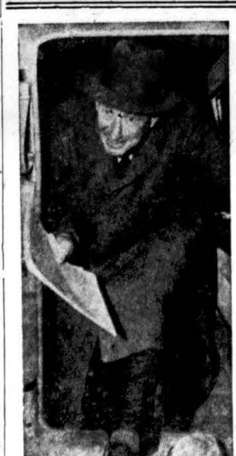
Adlai Stevenson, kaip paaikškėjo po pasikalbėjimo su prez. Eisenhower, vyks į Paryžių, Šiaurės Atlanto Pakto valstybių pastarime.

Iš viso pasaulio katalikai siunčia pagalbas pietiniam Vietnamui. Iš gautų lėšų ir būdami nepaprastai darbštūs, Vietnamo pabėgėliai vienu metu laikotarpyje įkūrė 286 naujus miestelius su 265-omis katalikų parapijomis. Dešimties mėnesių laikotarpyje jau buvo pastatytos 189-ios naujos bažnyčios. Panašiai atsirado ir 390 mokyklų. Dar lieka jiems išrišti viena didelė problema: kad visi gautų darbo ir galėtų pilnai išlaikyti patys savo šeimas. Jokiame kitame krašte — be Vietnamo — išėmimų pasitraukimas iš komunistinio režimo neturėjo tokio aiškaus pobūdžio, kad yra bėgama nuo religinio persekiojimo, siekiant išlaikyti save ir savo vaikus laisvėje ir gyventi pagal savąją religiją.