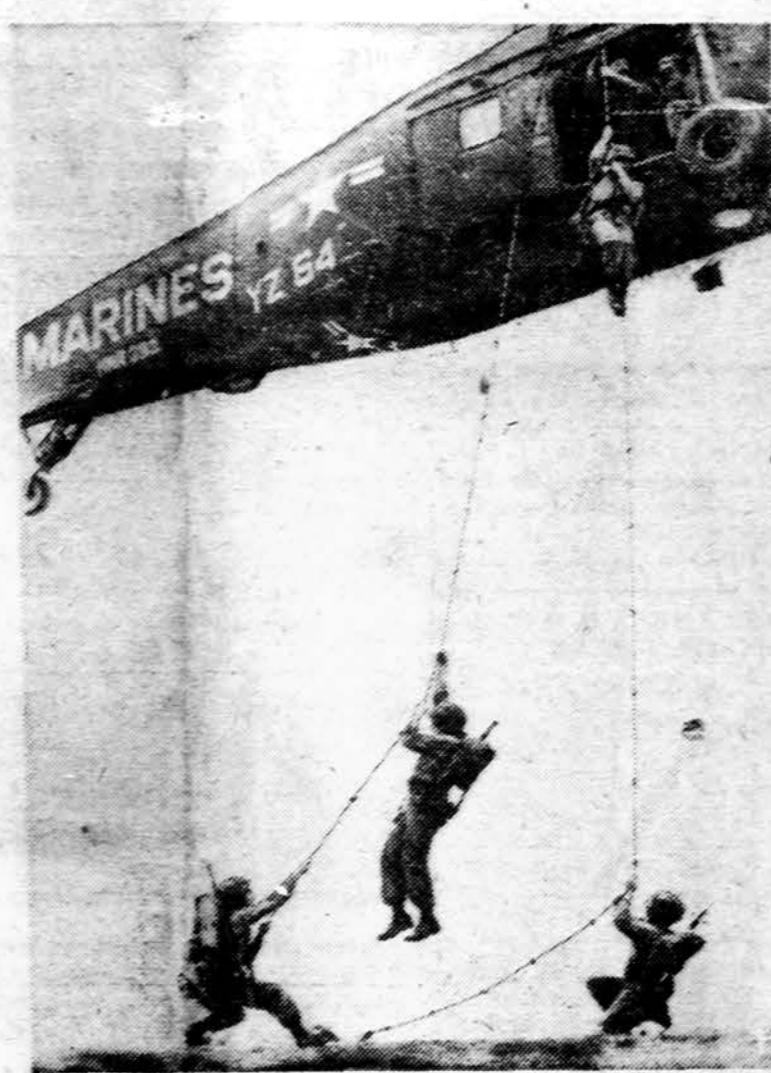
Čia matome nusileidžiančius marinius iš helikopterio vienoje JAV vietovėje. (INS)