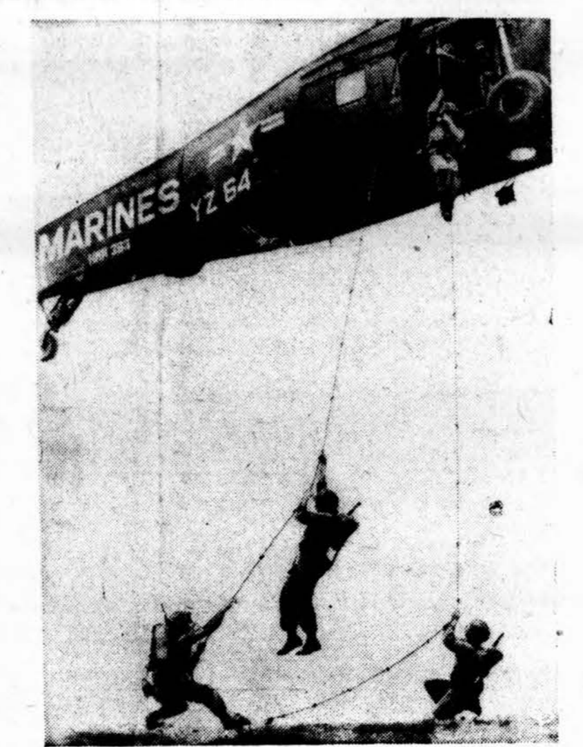
Čia matome nusileidžiančius marinus iš helikopterio vienoje JAV vietovėje.