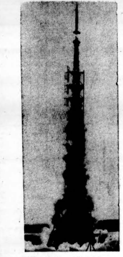
JAV aviacijos mokslininkai pranešė, kad jie išsėvė pirmąjį dirbtinį meteorą į tolimą erdvę. Dirbtinis meteoras lėkė 40,000 mylių per valandą. Nuotraukoje rodoma raketa, kuria buvo iššautas dirbtinis meteoras.

Brangūs arkliai Vienam centneriui pieno pagaminti Kauno rajono „Bolsheviko“ kolchoke yra sunaudojama 2,5 darbadienio, Biržų rajono „Tarybinio artojo“ kolchoke 5 darbadieniai, o kaifimniniame „R. vėlavos“ kolchoke net 9 darbadieniai. Paaikštinimui buvo paminėta, kad vienur tenka vienas darbininkas 10-čiai karvių, kitur tik 6. Pasirodo, kad ir eilinio kolūkio arkliai išlaikymas atsieina labai brangiai. Pavyzdžiui Linkuvos rajono „Pirmyn“ kolchoke vienam darbiniam arkliai išlaikyti 1956 metais išėjo 2,200 rublių! Ir tai nepriklausomai nuo to, ar arkliai dirbo, ar nedirbo. Vilniaus radijas lapkričio 17 d. laidoje žemės ūkio darbuotojams perdavė šalininkų tarybi-