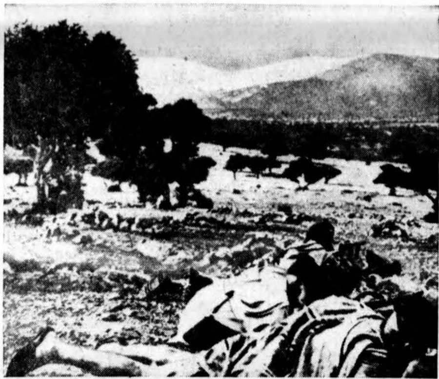
Įfni vietovėje Maroko ispanų militariniai garnizonai traukia mašintų ifni sukilėlių, kuriuos čia matome sugulčius ir laukiančius ispanų.