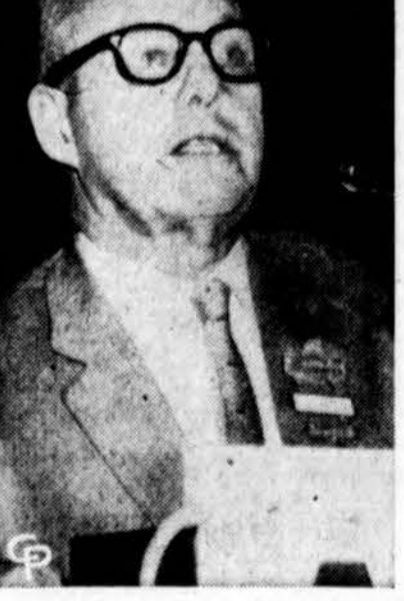
George Meany, AFL-CIO prezidentas, pareiškė Atlantic City konferencijoje, kad kėpyklų darbininkų unija bus išmesta iš AFL-CIO organizacijos, jei unija nepasistatys korupcijos.

• Egiptas ketina sudaryti kul tūrinius ryšius su Sovietų Sąjunga.