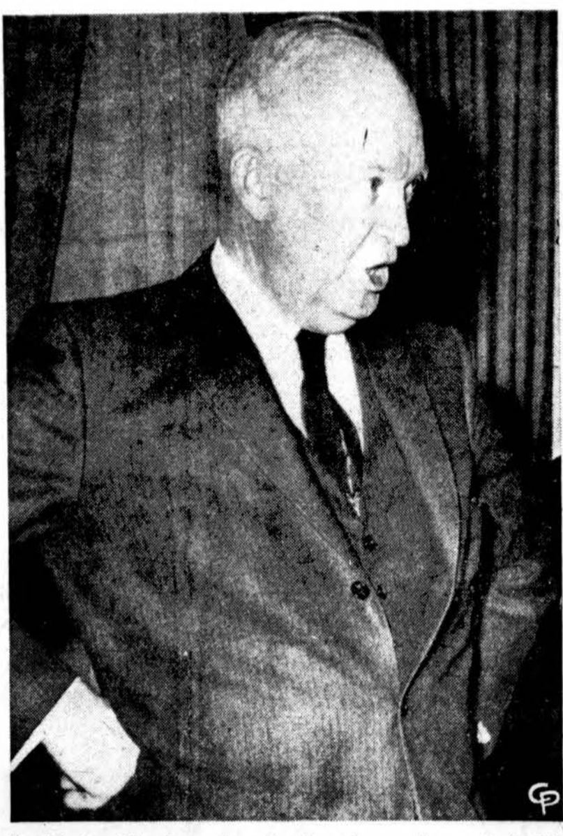
Prezidentas Eisenhoweris, pakankamai pasveikęs, entuziastiškai svarstė būsimos Šiaurės Atlanto Gynybos organizacijos (Nato) konferencijos planus. Prezidentas vyks į Nato konferenciją, kuri prasidės gruodžio 16 d. Paryžiuje.

Tik tas skirtumas tarp tų dviejų atvejų, kad pirmuoju atveju JT tarnautojas buvo per uolus ir sovietams padėjo, o antruoju — tarnautojas danas norėjo išvengti, kad laikurie dokumentai sovietams nepakliūtų.