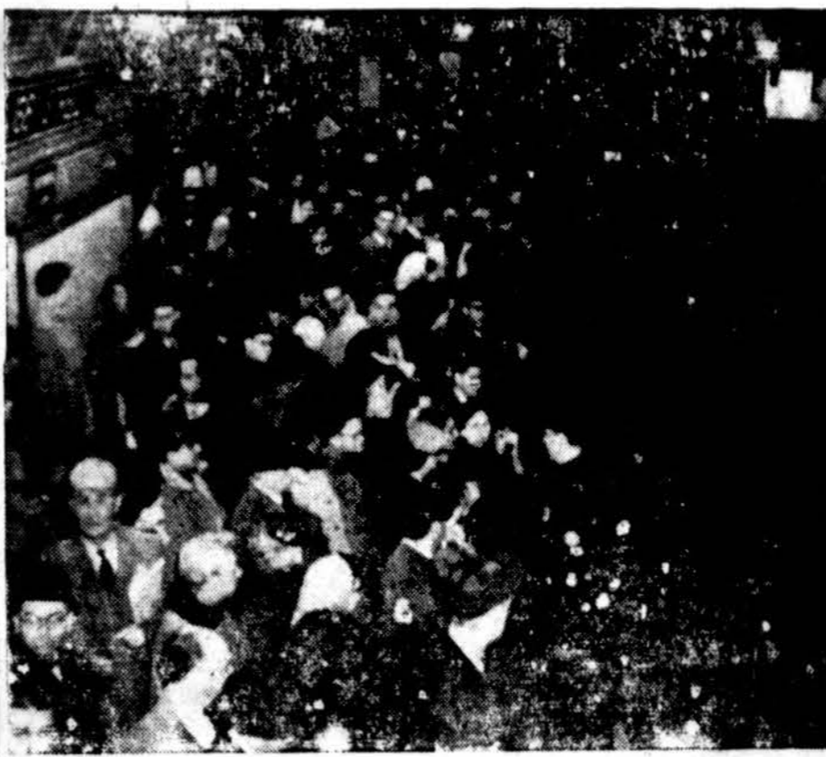
Sustrelkavus New Yorko požeminių traukinių vairotojams, tūkstanciai New Yorko gyventojų turėjo pavėluoti į darbą ir turėjo dar daug kitų nepatogumų.