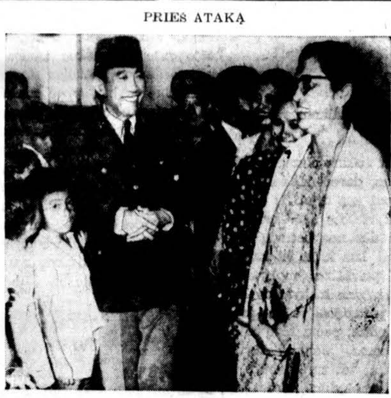
Indonezijos prezidentas Sukarno kalbasi su mokiniais Jahartos pradžios mokykloje. Keletą minučių po to šios nuotraukos padarymo pasikeisimoj numėtė j j keturias granatas. Sukarno išliko gyvas, bet 9 asmenys žuvo ir 150 sužeista.

Kai spaudoje buvo paleista gandų, kad šunelis galis grįžti žemėn, vienas išmintingas anglų kunigas tuokdamasis pasakė: Prašykime Dievą, kad tas sutvėrimas nukristų kur j jūrą, bet ne prie Maskvos, nes, jei jis nusileistų prie Kremliaus, mums nebėlik tu žemėje vietos'. Deja šunelis nenukrito nei j jūrą, nei į Kremliaus tvirtovę. Jei tai propaganda, koks būtų jos tikslas? Visi galvoję žmonės prieina bendrą išvadą, kad, jei kiltų nau-