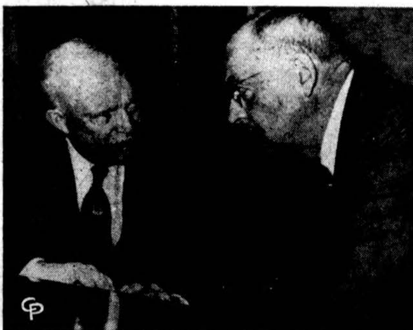
Prezidentas Eisenhoweris ir valstybės sekretorius Dulles aptarė Šiaurės Atlanto Gynybos organizacijos (Nato) konferencijos klausimus. Dulles vakar išskrido į Paryžių. Prezidentas Eisenhoweris šiandien skrenda į Nato konferenciją, kuri prasidės gruodžio 16 dieną Paryžiuje.

Atrodo, kad Vakarai Maskvos karo grėsmės nebijo, jei Paryžius, Londonas ir Bonna nesirūpina karinių jėgų stiprinimu Vokietijoje. Kiekvienas kraštas pradedą rūpintis siaurais tautiniais interesais: Prancūzija — Alžirijoje, Anglija — savo pinigų (svaro sterlingo) sveikata, Vokietija — savo pramonę, prekybą ir markę.