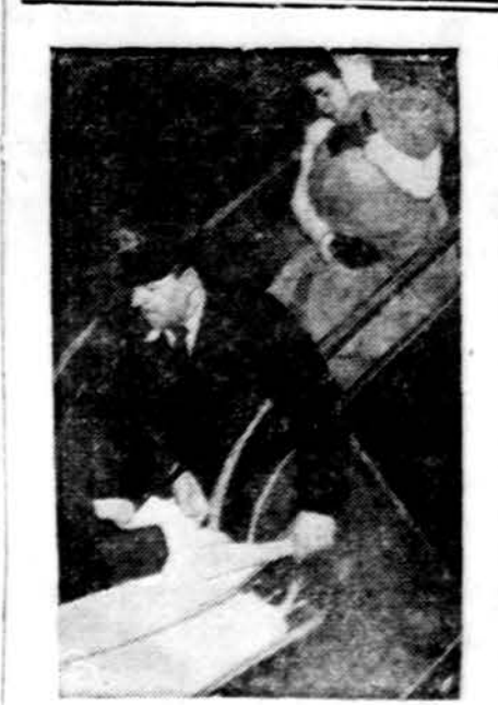
Airijos aerodrome išnešama motina, o stuaresė neša vaiką, kuris gimė lėktuve, skrendant be sustojimo į New Yorką iš Belgrado su 75 vengru pabėgėliais. Po keturių valandų sutrukdytas lėktuvas, būdamas vienu keleviu sunkesnis, išskrido į New Yorką.