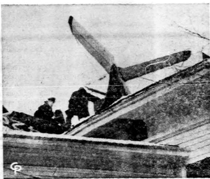
Lėktuvas kovoj su audra New Haven, Conn., buvo priverstas nusileisti ant metodistų klebonijos stogo. Lakūnas ir jo keleivis sužeisti. (INS)

prasti, nes jie labai savimeilūs ir greit skaudžiai įsiseidžia, o iš kitų garbės jie nereikalauja.