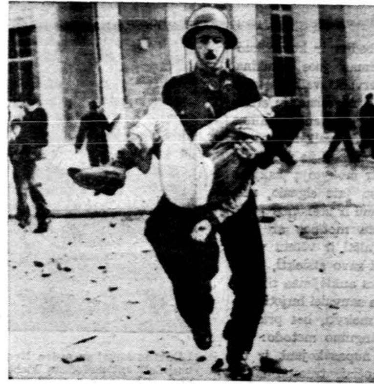
Kipro salos policininkas neša sužeistą mokinį po to, kai mo-kykloje buvo numalšintos antibritiškos demonstracijos. Su-žeista dešimtis gimnazistų.

tikslas ir jį nuo jos niekuomet čiai Europai sumenkėjus. Ang-neatsisakys. Užimtų sričių vjo-sustodama mažėja tiek sienose, dėl labai svarbi priemonė ir ji tiek ekonominės bei politinės į-isigyjama tik absoliučiam pa-vergence. (Nebūtinai kariniame pavergime. Gali būti ir kultū-rinis bei ekonominis pavergi-mas). Šalia to Rusija neabejo-tinai stiprėja ekonominėje ir technologinėje srityje. Jos pa-siekti laimėjimai yra dideli ir su jais nesiskaityti negalima.