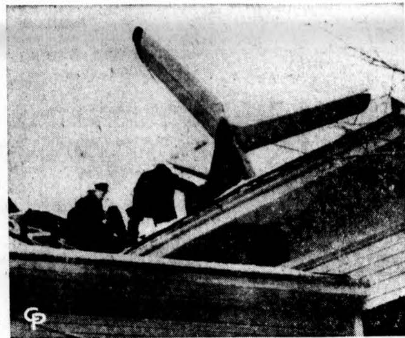
Lėktuvus kovoj su audra New Haven, Conn., buvo priverstas nusileisti ant metodistų klebonijos stogo. Lakūnas ir jo keleivis sužeisti.

prasti, nes jie labai savimeilūs ir greit skaudžiai įsižeidžia, o iš kitų garbės jie nereikalauja.