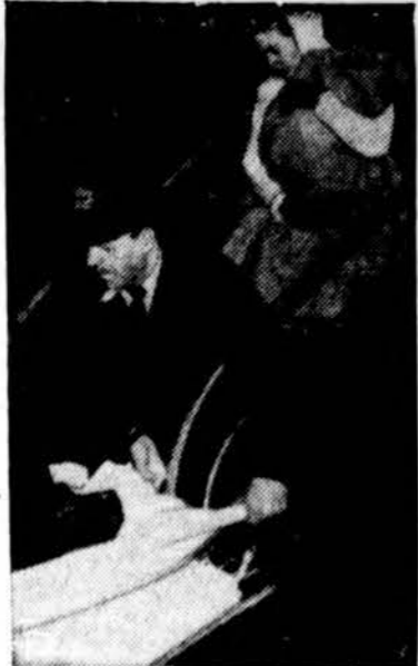
Airijos aerodrome išnešama motina, o stumdoma neša vaikas, kuris gimė lėktuve, skrendant be sustojimo į New Yorką iš Belgrado su 75 vengrų pabėgėliais. Po keturių valandų sutrukdymo lėktuvas, būdamas vienu keleivių sunkesnis, išskrido į New Yorką.