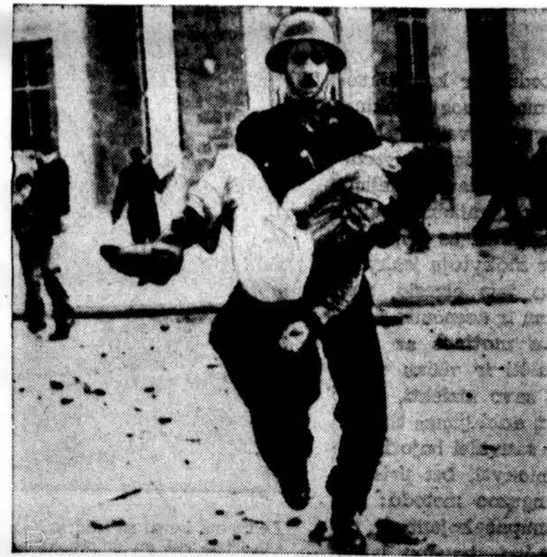
Kipro salos policininkas neša sužeistą mokinį po to, kai mokykloje buvo numalšintos antibritiškos demonstracijos. Sužeista dešimts gimnazistų. (INS)

tiktas ir ji nuo jos niekuomet neatsisakys. Užimtų sričių visapusiškas integravimas yra todėl labai svarbi priemonė ir ji įsigyjama tik absoliučiam pavergime. (Nebūtinai kariniame pavergime. Gali būti ir kultūrinis bei ekonominis pavergimas). Šalia to Rusija neabejotinai stiprėja ekonominėje ir technologinėje srityje. Jos pasiekti laimėjimai yra dideli ir su jais nesiskaityti negalima.