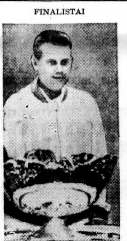
Gardner Mulloy stovi prieš Daviso...

Dabartiniu laiku šioje salėje yra įsikūrę koksai tai kultūros veikimo centras ir visos pa-