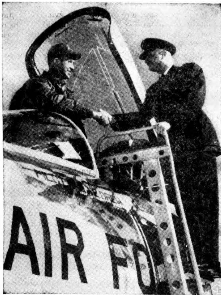
Majorą Drew sveikina generolas McCarty po to kai šis pasiekė naują rekordą išvyssęs per valandą 1,190 mylių greitį. Ankstyvesnis pasaulinis rekordas priklausė britam, 1,132 mylios per valandą.