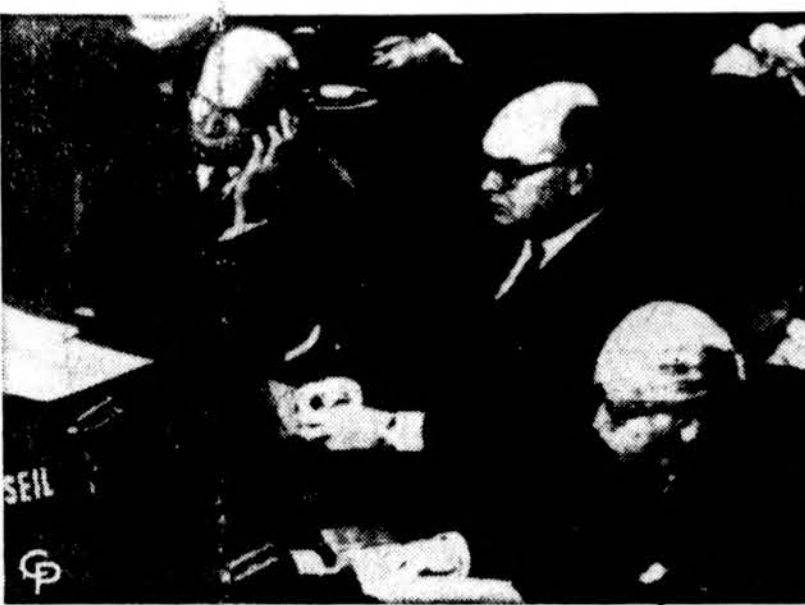
Prezidentas Eisenhoweris klausosi Luksemburgo premjero Joseph Bech (dešinėje) kalbos Šiaurės Atlanto Gynybos organizacijos (Nato) konferencijoje Paryžiuje. Prezidento Eisenhowerio kairėje yra Nato generalinis sekretorius Paul-Henry Spaak.

Atominė energija nėra nauja, — Strauss sakė, — ji visuomet jau buvo nuo to laiko, kai Dievas sutvėrė visatą. Naujas tik dalykas yra, kad žmogus pri taiko ir panaudoja atominius principus, kuriuos gali pakreipti į gerą ar į blogą.