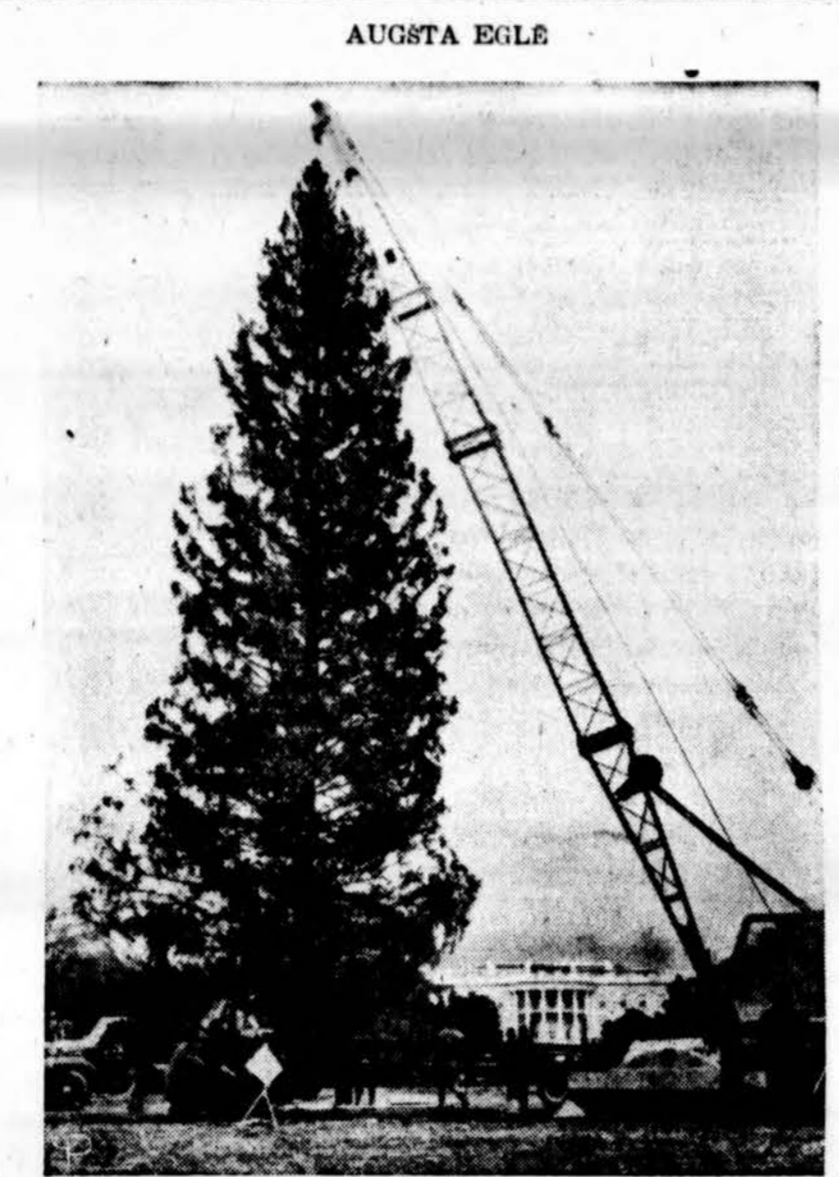
Baltųjų rūmų kieme pastatyta 60 pėdų augstumo kalėdinė eglė.

Užsakymus su pinigais siuskite: "DRAUGAS" 4545 West 63rd Street, Chicago 29, Ill. Platintojams duodama nuolaida 50,000 vaikų.