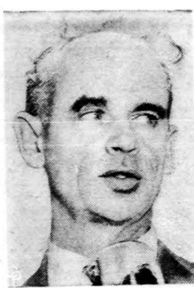
Dr. Ernest Stuhlinger teigia, kad JAV armija galėjo satelitą išsauti jau 1956 m., tačiau visa raketų programa buvo vykdoma truputį vėlavai.

esant, kviečia Chicagoje veikiančių ateitininkų padalinių valdybų pasitarimus.