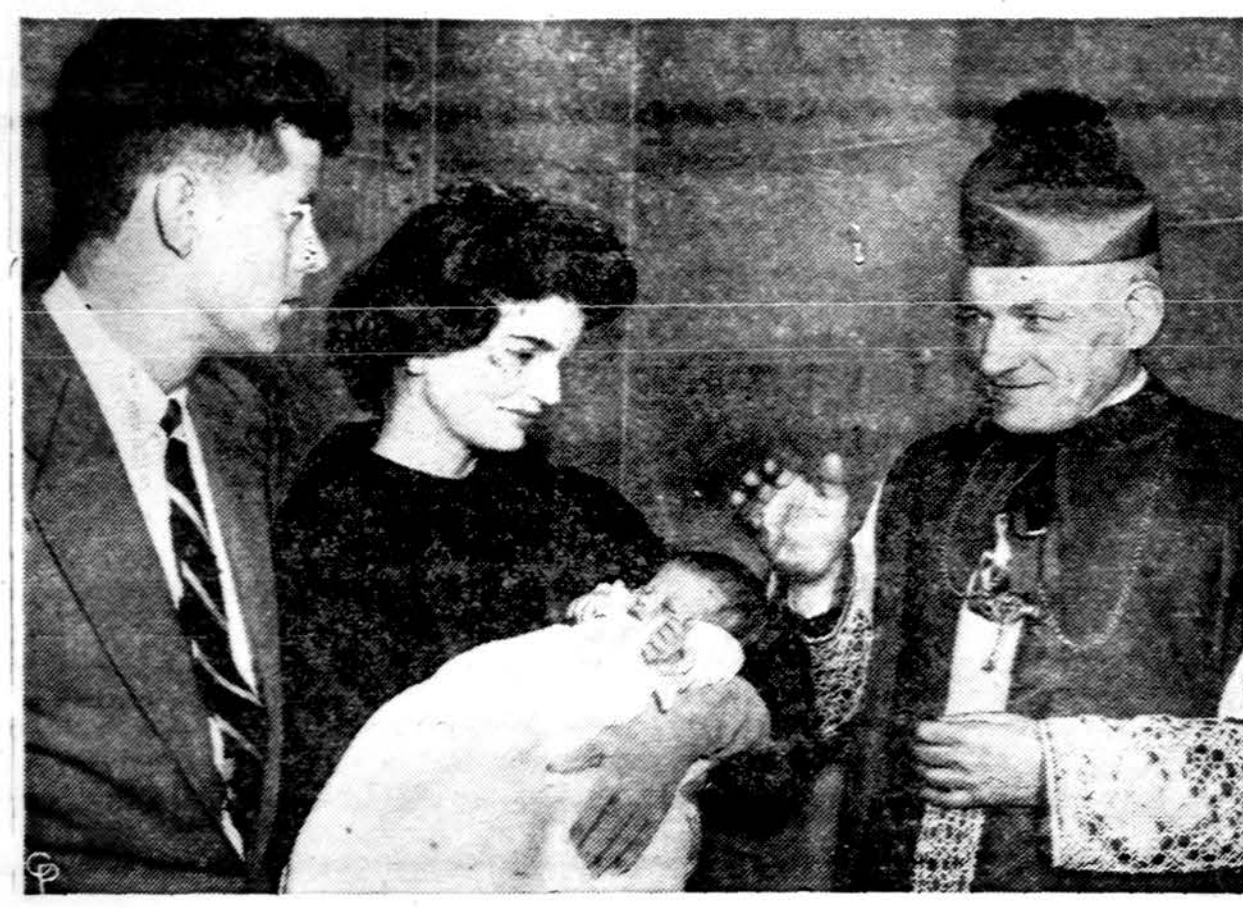
Bostono arkivyskupas Cushing laimina sen. Kennedy dukrą Caroline, po to kai ji buvo pakrikštyta St. Patric Katedroj New Yorke. Kūdikį laiko sen. žmona, šalia stovi pats senatorius Kennedy.