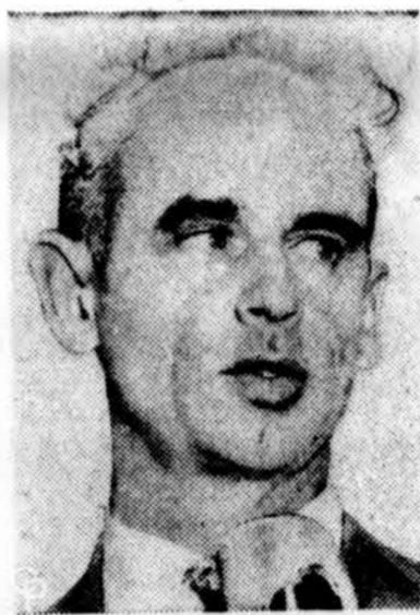
Dr. Ernest Stuhlinger teigia, kad JAV armija galėjo satelitą iššauti jau 1956 m., tačiau visa raketų programa buvo vykdoma truputį pėvelai.

esant, kviečia Chicagoje veikiančių ateitininkų padalinių valdybų pasitarimus.