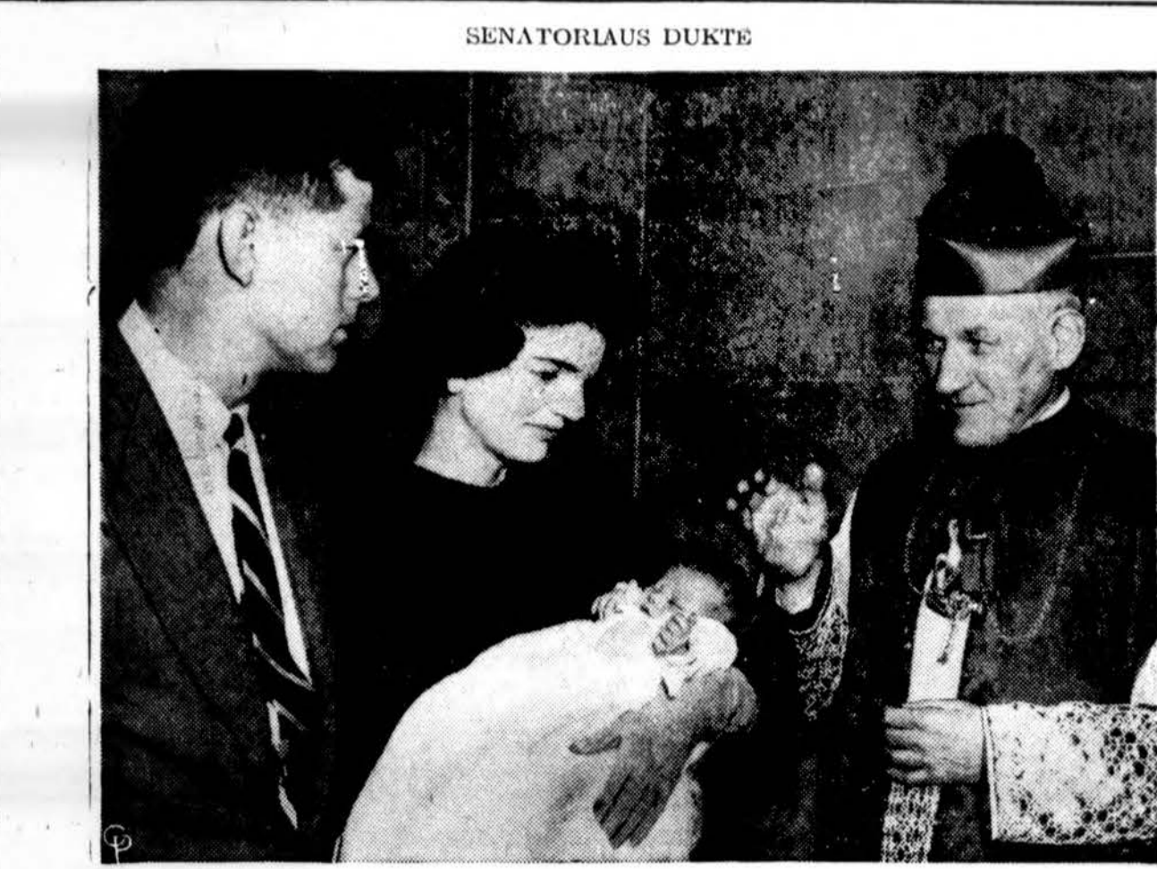
Bostono arkivyskupas Cushing laimina sen. Kennedy dukrą Caroline, po to kai ji buvo pakrikštyta St. Patric Katedroj New Yorke. Kūdikį laiko sen. žmona, šalia stovi pats senatorius Kennedy.