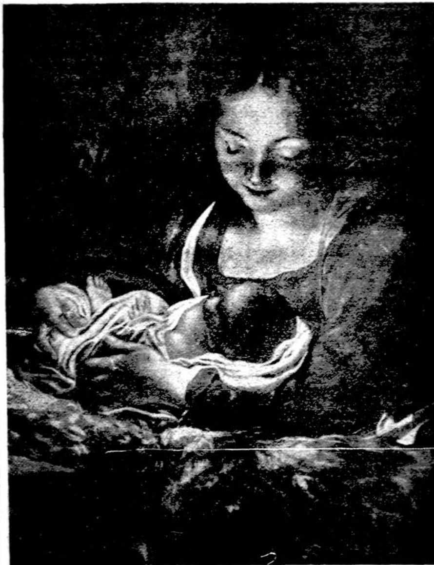
Motina ir kūdikis Corregio

Gruodžio 23 d.: Šv. Viktorija; lietuviški: Vebutas ir Zibutė. Gruodžio 24 d.: Kūčios, Šv. Adomo ir Jevos; lietuviški: Jogaila ir Minvydė. Saulė teka 7:14, leidžiasi 4:23. Oras Oro biuras praneša: Chicagoje ir jos apylinkėje šiandien — šalčiaus.