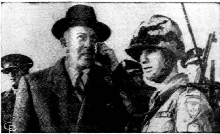
JAV apsaugos sekretorius Neil McElroy kalbasi su parašintininkų dalinio karininku parašintininkų manevrų metu netoli Muencheno, Vokietijoje. Jis matė daugiau kaip 700 parašintininkų masiniai nusileido iš padangių.

● Mašinų gamybos racionalizatorių konferencija įvyko Vilniuje gruodžio 9 d. Konferen-