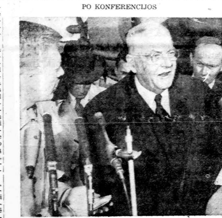
Sekr. J. F. Dulles kalba su žurnalistais, grįžęs iš Nato konferencijos.

Kapitalo išplėtimis industrijose kitais metais, manoma, sumažės 5% nuo 1957 m. lygmenis. Tačiau bus daug daugiau skiriama tyrimū ir išplėtimū veik visose industrijose. Populiacijos prieauglis natūraliu keliū pakels bendrā produkto paklausā. Akcijū biržoje spėjama, kad visā eilē ju pasiekė kainū žemumo minimumu ir rinka bus aktyvi. Žinoma, negalima pamesti iš akiū esamo įtaurumo tarpinčių jvykiuose, bei politinėse sferose. Tū kiama, kad ateities mėnesiais net tinkama momentā pirkimo-pardavimū paprastū (common stock) akcijū, kurios turės augstā laipsniavimą. Atkreipiamas dėmesys į ilgesnio laikotarpio investicijas, kur Mutual funds turės didi pasisekima, nes žmonės pradeda suvokti infliacijos grėsmę ir kapitalo-santaupū vertes mažėjimā.