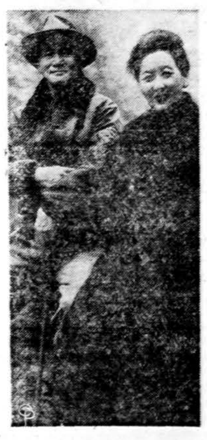
Tautinės Kinijos prezidentas Chiang Kai-Shek ir jo žmona apžiūrėjo 190 mylių ilgumo „East-West“ vieškelį Formozos saloje. Kelias, tiesiamas per uolus, bus baigtas 1959 metais. Prie kelio pavidimo rątomis dirba 11,000 darbininkų.