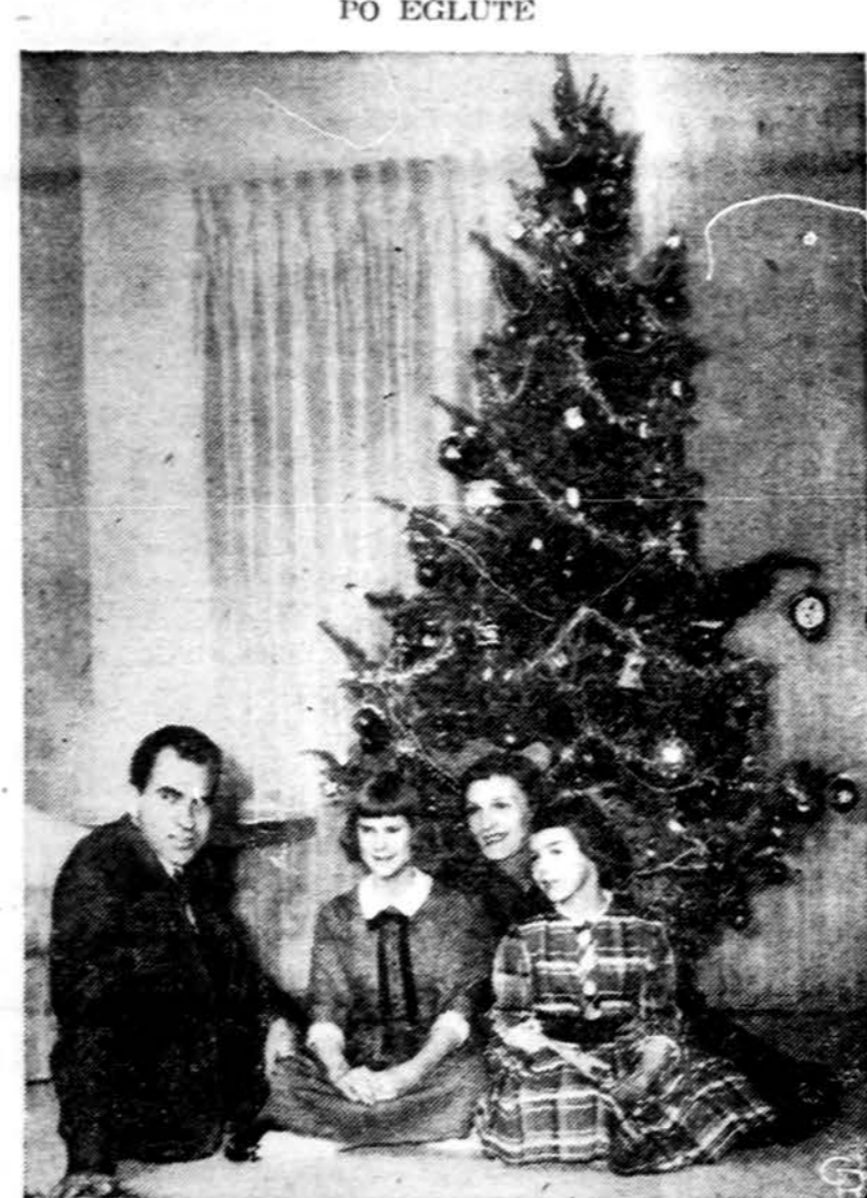
Viceprezidentas Nixon po eglutės savo namuose su žmona ir dukterimis.