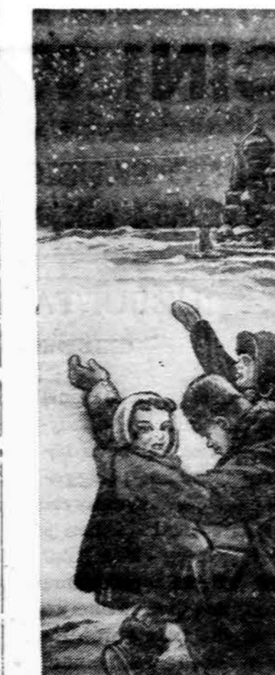
Rusės mergaitės džiaugiasi žvaigždėtu dangum Kalėdų naktį, gi politrukas aiškina, kad jokio Dievo nėra, o tėra tik viską žinanti ir valdanti kompartija. (INS)

ta, tačiau ši iniciatyva susilaukė plačių visuomenės sluoksnių pritarimo.