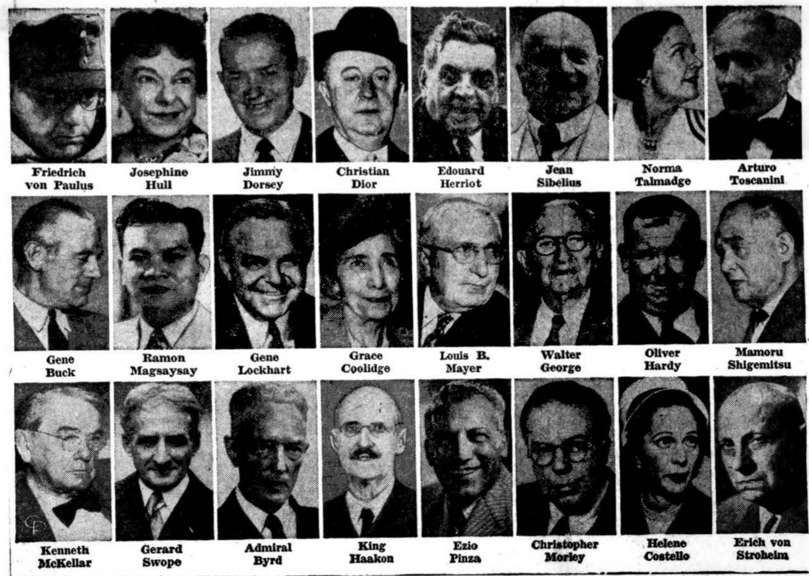
Friedrich von Paulus, Josephine Hull, Jimmy Dorsey, Christian Dior, Edouard Herriot, Jean Sibelius, Norma Talmadge, Arturo Toscanini, Gene Buck, Ramon Magsaysay, Gene Lockhart, Grace Coolidge, Louis B. Mayer, Walter George, Oliver Hardy, Mamoru Shigemitsu, Kenneth McKellar, Gerard Swope, Admiral Byrd, King Haakon, Elio Pinza, Christopher Morley, Helene Costello, Erich von Stroheim

— Prezidentas Eisenhoweris vakar patvirtino naują mokslo programą, kuria bus parūpinta kasmet 10,000 federalinės kolegijos stipendijų, kad talentingieji mokiniai, baigę augštesnes mokyklas, galėtų studijuoti gamtos ir matematikos mokslus. Ketverių metų mokslo programai numatytas vienas bilionas dolerių. — Prancūzijos premjeras Felix Gaillard siūlo susaukti Vakarų — Rytų valstybių vyriausybių galvų konferenciją. — Izraelio premjeras Ben-Gurion vakar nutarė atsistatydinti iš premjero pareigų, kadangi tarp ministerių kilo politiniai nesutarimai. Šiandien įteiks atsistatydinimą Izraelio prezidentui. — Vakarai vakar aiškiai pareiškė, jog jie nenusilenks rytinės Vokietijos komunistų naujam kelionių suvaržymui, kad priverstų sąjungininkus pripažinti rytinės Vokietijos raudonųjų režimą. Rytinė Vokietija pranešė, kad nuo 1958 m. sausio 1 d. civiliniai keleiviniai privalo turėti rytinės Vokietijos vizas, vieton rusų vizų, įžengti ar pravažiuoti per rusų satelitą. — Prezidentas Eisenhoweris turbūt 1958 m. sausio mėnesį pasisų kongresui 1959 fiskalinių metų 74 bilionų dolerių biudžetą.