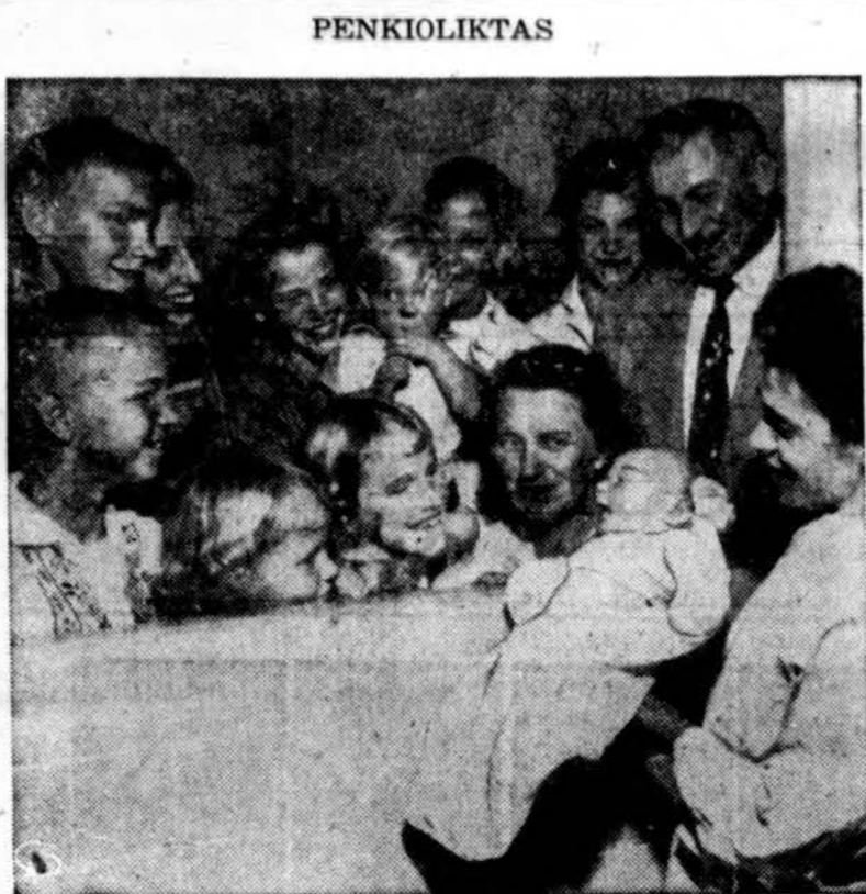
Schouten šeimoje, Lynwood, Calif., gimė 15-tas vaikas ir juo džiugiais tėvai, broliai ir seserys. Vyriausias vaikas 22 mė- tų, jauniausias buvo 22 mėn.

LEGULO, Department D, 5618 W. Eddy St., Chicago 34, Ill.