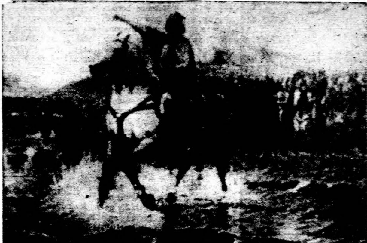
Vytautas prie Juodųjų jūrų