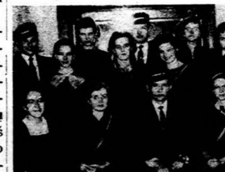
Latvių studentų or-ganizacijos Dzintars grupė Indianapolis

Chicagoje gyvena apie 400 lietuvių studentų. Iš šių tik 300 yra užsiregistravę Chicagoje sky-riuje. Į susirinkimus atsilanko 120. Tai aiškiai parodo, kad