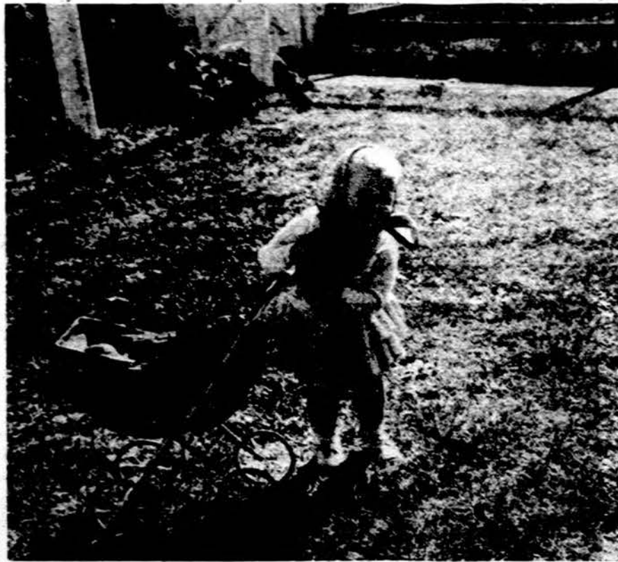
Sodinsiu lėlę į vežimėlį. Toli keliausim per vieškelį...

PALATINE BARGAIN BASEMENT 1263 NO. PAULINA IR 1286 MILWAUKEE AVE. (KAMPAS) Telef. HUMBOLDT 6 3353 P. S. Prašome pranešti savo draugams ir pažįstamiems, kad jie pasinaudotų šiomis nepaprastomis lengvatomis, pasiųstų medžiagų siuntinius.