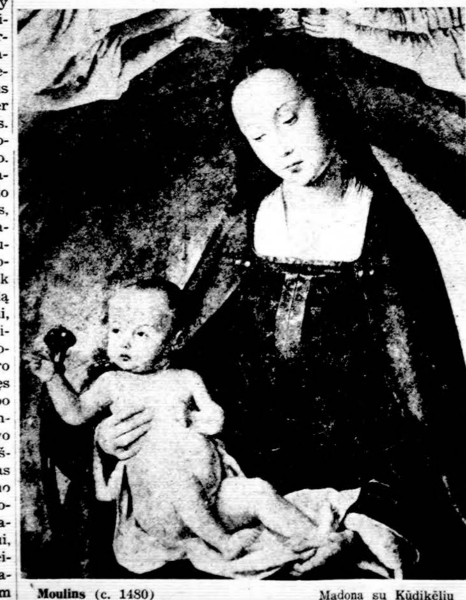
Moulins (c. 1480)