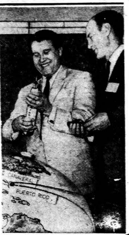
Dr. Werner von Braun

Prisidėjęs prie de Gaulle sąjūdžio Malraux nuo 1947 metų buvo pasidaręs ir "liaudies tribunū". Jis tada Žiemos vėlo-drome bei kitose Paryžiaus ar provincijos didžiulėse salėse savo vizijomis, savo balsu, savo judėjimais, savo sukoncentruotu transu sugebėdavo tiesiog pavergti klausytojus. Tada de Gaulle sąjūdis paskendo parlamentarizme, ir Malraux vėl labiau pašventė savo Musee Imaginaire. Greta savo paties knygų, kurioms jis peržiūrėdavo dešimtis tūkstančių iliustracijų, dažnai dirbdamas į parą po šešiolika valandų, jis dar parengė ir Meno enciklopediją, apimančią daug tomų. Neabejojama, jog jis nenoriai nuo to, taip ilgai ruošiamo darbo, atitraukė, kai jį pasiekė de Gaulle pakvietimas. Jis paklausė to pakvietimo ne dėl garbės, bet dėl draugystės ir iš pareigos.