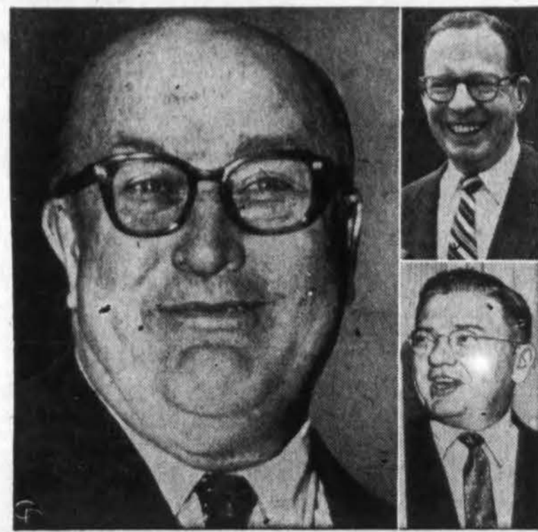
Richard Nixon bustinė Chicagoje vyriausia galva yra Leonard Hall iš New Yorko. Jo talkininkai yra Meade Alcorn (viršų, dešinė) ir Ray Bliss.

Vargiai Maskva ir Peipingas galėtų apginti Castro, jeigu šis kraštas pasiryžtų gražinti Kūboje tvarką. Delto Chruščevo grasinimus netenka vertinti rimtai. Bet tai, kas vyksta Kūboje, rodo, kad bolševizmas jau apsikasęs Amerikos pašonėje. Raudonųjų lizdų yra pilna Pietų Amerika. Ne tik Kūboje, bet