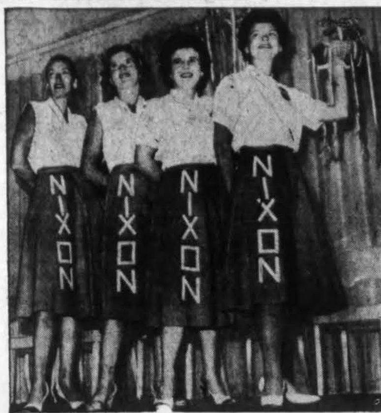
Respublikonų vyriausioje būstinėje Conrad Hilton viešbutyje Chicagoje merginos taip originaliai reklamuoja viceprez. Nixoną. Jos visos yra iš Park Forest, Ill.

ATDARA: Pirmadienį nuo 12 iki 8, antradienį nuo 9 iki 4, ketvirtadienį ir penktadienį nuo 9 iki 8. Trečiądienį uždaryta visą dieną, o šeštadienį nuo 9 iki 12:30 val. po pietų.