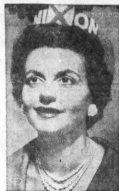
William Stratton, Illinois gubernatoriaus žmona, tokią šukuoseną demonstruoja respublikonų konvencijoje Chicagoje.

Tremtinių Metams besibaigiant Balfo centro valdyba pasiskyrė 39 šeimoms, gyv. Vokietijoje, 35,805 DM, už kuriuos V. Vokietijoje likusieji tremtiniai galės nusipirkti būtiniausių įsikūrimo baldus, kiti darbo įrankius ar susitvarkyti gyvenvietes.