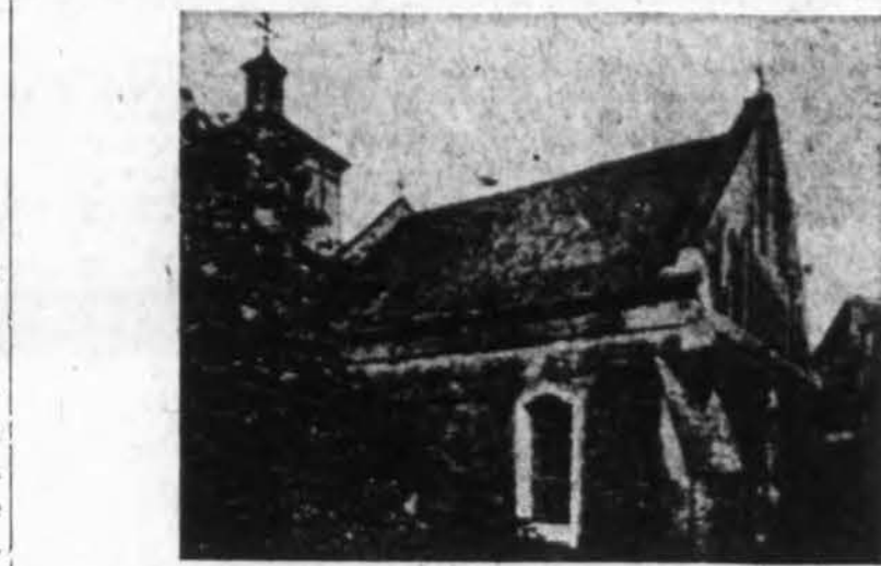
Lietuvių šv. Mikalojaus bažnyčia Vilniuje, okupantų bolševikų paversta sandėliu.

Patys nebejausdami, tapome kapitalizmo vergais: tokia iškilminga dvidešimtmečio proga, užuot kalbėję apie dvasinius, nusikalbėjome apie žemiškus daly-