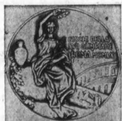
Olimpinis medalis, auksinis, kurį gaus pirmų vietų laimėtojai Romos olimpiadoje, prasidedančioje rugp. 25 d. Priešakinėje pusėje (viršų) Pergalės dievė, tiesiant laurų vainiką; antroje pusėje — nugalėtoja atitęta neša ki-ti rungtynių varžovai.