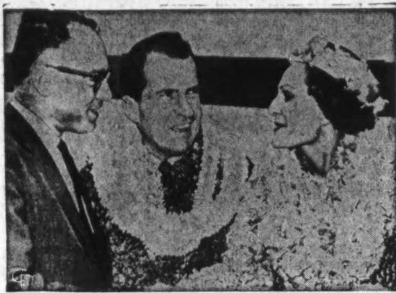
Viceprez. Nixon ir žmona pasitinka Havajų gub. Quinn Honoluluose. Niksonai papuošti tradiciniais Havajų vainikais.

Pasaulis nustebo, kad, vos kelioms savaitėms praėjus nuo išrinkimo naujo švento Tėvo, Jonas XXIII paskelbė, kad veikia numatoma šaukti naują visuotinį Bažnyčios susirinkimą. Šiandien, nepraėjus nė dviems metams, jau sudarytos įvairios komisijos paruošiamoms susirinkimo darbams atlikti. Dar yra sunku pasai-