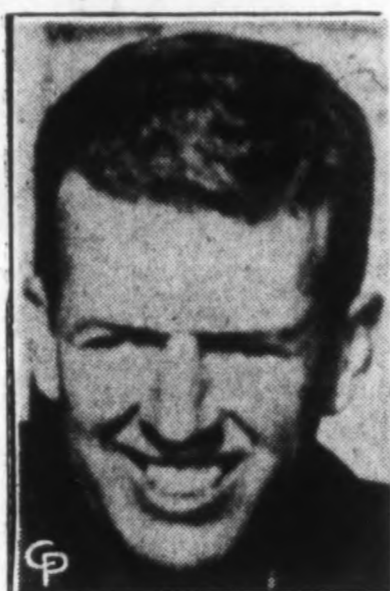
Pilotas Joe Walker raketiniu lėktuvu X-15 virš Edwards aviacijos bazės, Cal., tyrimų tikslu per valandą nuskrido 2,150 mylių — daugiau kaip tris kartus už garsą 10 minučių bandyme ketvirtadienį. Walker, 38 metų, pralenkė mirusio kapitono Milbur Apt. padarytą 2,094 mylių rekordą per valandą prieš ketverius metus.

Šimtai milijonų markių skiriami importuoti mėsa ir sviestas, nes norima sumažinti maisto trūkumą. Dėl to sumažintas mašinerijos importas.