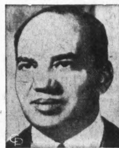
Dominikonų Respublikos prezidentas Hector Trujillo pasitraukė iš to posto, nes negaluoja.

Šiuo metu Gabon respublikoje yra dvi vyskupijos: Libreville ir Mouila. Jos turi apie 100 kunigų, apie pusantro šimto brolių ir seserų vienuolių ir apie 1,100 katekizmo mokytojų.