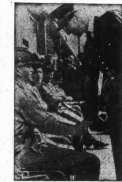
Belgijos karalius Baudouin kalbasi su lengvai sužeistais belgų kareiviais, atvykusiais į Briuselį iš Kongo, kur jie palaikė tvarką.

Šiuo metu sėkmingai vyksta vyskupo Stenno beatifikacijos byla.