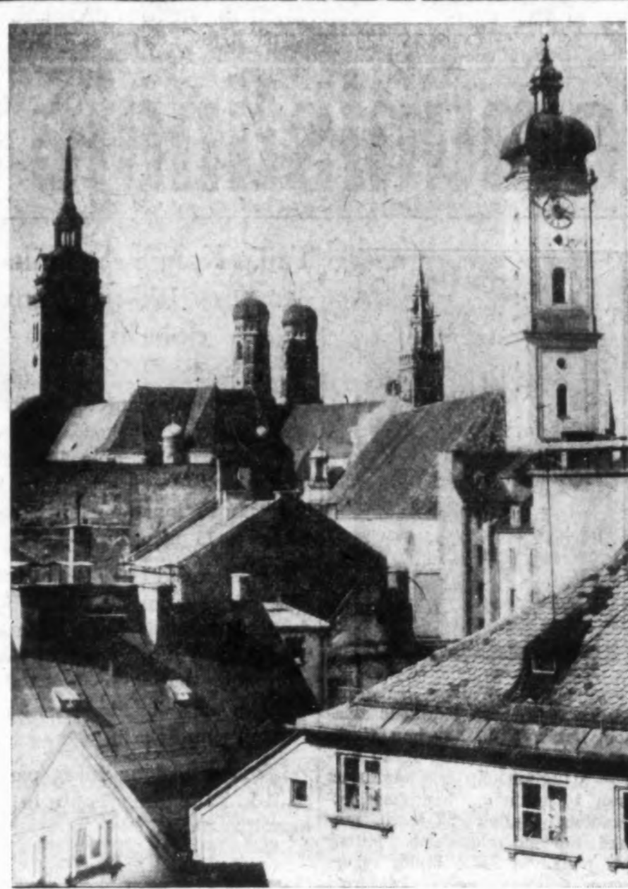
Miuncheno miesto vaizdas: vidury — katedros bokštas, dešinėje — rotušės bokštas, kairėje — Sv. Petro seniausios Miuncheno bažnyčios bokštas.