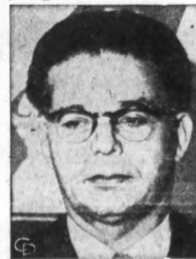
Joaquin Balaguer, naujas Dominikonų Respublikos prezidentas.

Gen. Trujillo paskirtas vadovauti delegacijai