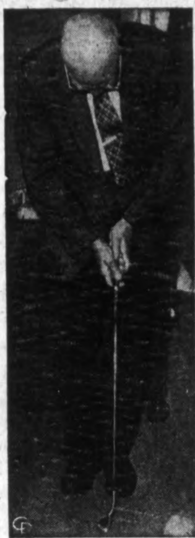
Prez. Eisenhoweris pasiryžęs gerai sulošti golfą New Port, R. I., su vietos Prekybos Rūmų pirmininku.

Didžioji dalis maldininkų jau pirmąją kongreso dieną suvažiavo į čia iš visų pasaulio kraštų: iš Australijos, Argentinos, J. A. Valstybių, Kan-