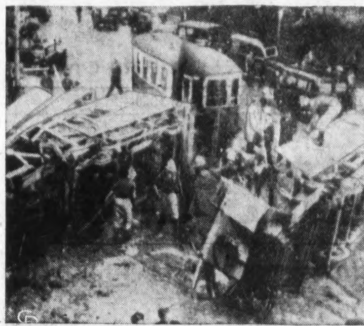
Vienoje nuo bėgių nuoko troleibusas ir katastrofoje žuvo 17 asmenų, kritiškai sužeista 30.

NAUJAS KURSAS APIE DARBĄ IR RINKIMUS New YORKAS. — Emil Star, buv. Amalgamated unijos švie-