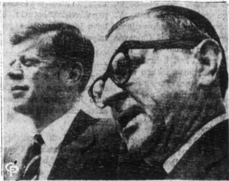
Sen. Kennedy baigė konferenciją su Iowa gubernatorium Loveless žemės ūkio klausimais. Gub. Loveless Politinio komiteto agrikul-tūros progreso pirmininkas. Tokio pobūdžio programą sen. Kennedy pradės vykdyti, žinoma, jeigu bus išrinktas prezidentu.

Katanga turi daug "atominių" žemės turty. Žemės turtai yra milijoniškos pramonės pagrindas. Nė viena Afrikos šalis sa-