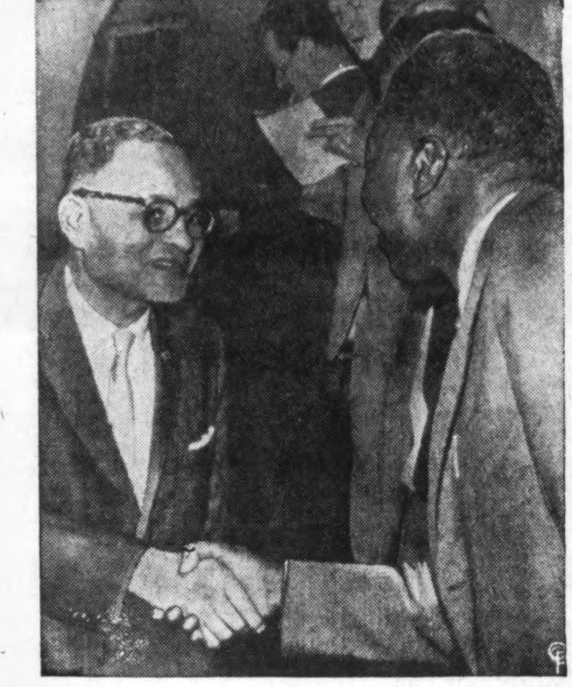
Jungtinių Tautų generalinio sekretoriaus pagalbininkas Ralph J. Bunche sveikinasi su Katangos premjeru Moise Tshombe (dešinėje) susitikus jiems Elisabethvillėje. JT. saugumo taryba su-kvietė nepaprastą posėdį spresti Kongo ir Katangos provincijos klausimų. Bunche yra įsitikinęs, kad JT kariniai daliniai neturėtų įžengti į atsiskyrusią Katangos provinciją nuo Katango vyriausybės, nes katangiečiai atidengtų ugnį.

GENEVA, Šveicarija. — Tarp-tautinė teisininkų komisija sek-madienį kaltino raudonąją Ki-niją, kad ji žudo, kankina, prie-vartauja ir sterilizuoja žmones Tibete. Komisija atspausdino 340 pus-lapų pranešimą apie Kinijos raudonųjų žiaurumus. Tarp kitko rašoma, mažiau-