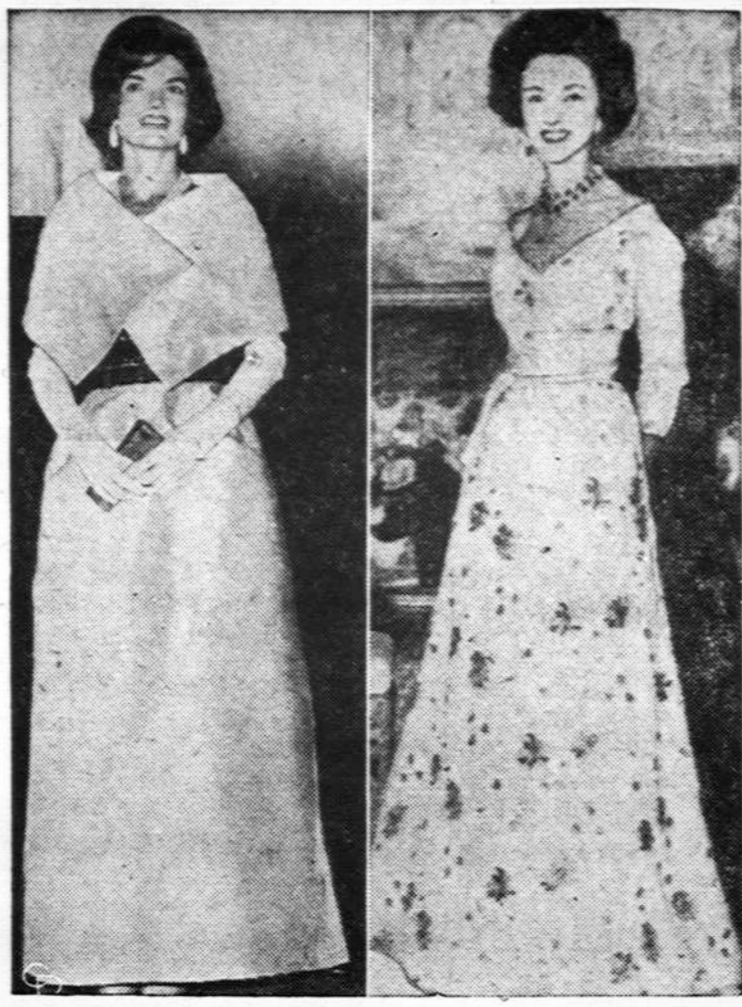
New Yorke 2,000 ekspertų pripažino, kad pasaulyje skoningiausiai apsirengus moteris yra prez. Kennedy žmona Jacqueline. Antroji yra ponia Loel Guinness (dešinė) iš Britanijos.