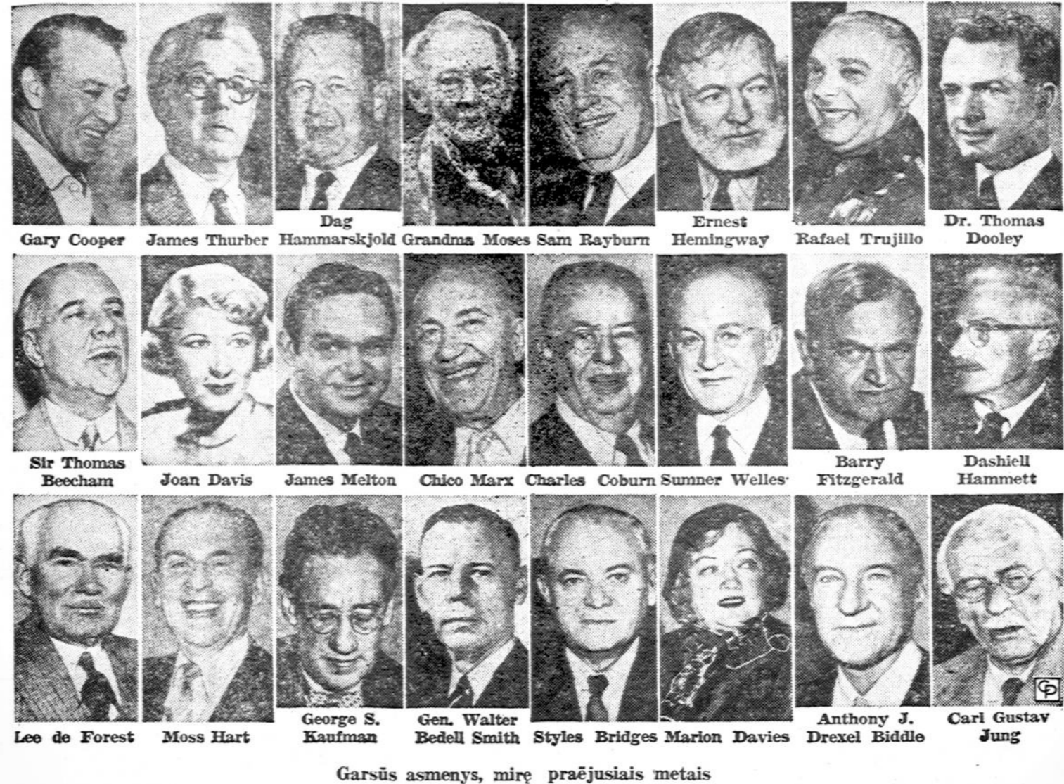
Garsūs asmenys, mirę praėjusiais metais

Sausio 8 d.: šv. Apolinaras, šv. Severinas, Gintė. Sausio 9 d.: šv. Marcijonas, Algis, Gobja. ORAS Oro biuras praneša: Chicagoje ir jos apylinkėse šiandien — nuo 10—15 laipsn., galimas sniegas; rytų — šalta, galimas sniegas. Saulė teka 7:18, leidžiasi 4:36.