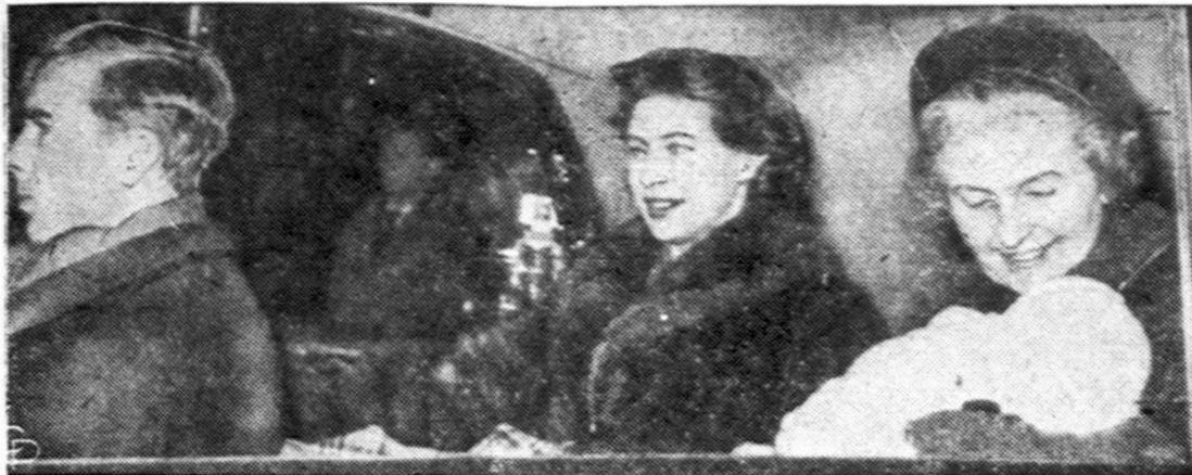
Princesė Margareta ir jos vyras grįžta iš po žiemos atostogų į savo rūmus. Dešinėje auklė laiko jų sūnų.

— Tai darbas, kuriuo ne tik kitiems padėdi, bet ir sau daug džiaugsmo susilauki, ypač, kai