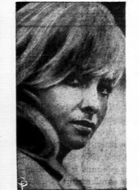
Akt. Gina Lollobrigida pasirengusi vaidinti Romoje, Italijoje, naujai sukamam filme "Beauty of Ippolita".