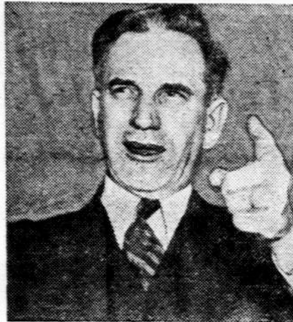
John McCormack, JAV atstovų rūmų pirmininkas

Š. m. sausio 10 d. veteranas kongresmanas iš So. Bostono, išbuvęs atstovų rūmuose 33 metus ir ten labai sumaniai bei ištvėringai dirbęs, buvo išrinktas JAV atstovų rūmų pirmininku vietoj mirusio Sam Rayburn. Tai pirmas atsitikimas, kad į tą vietą išrinktas katalikas. Atstovų rūmų pirmininkas rango atžvilgiu yra trečias. Prezidentui ir viceprezidentui mirus ar atsiskėius, jis taptų prezidentu.