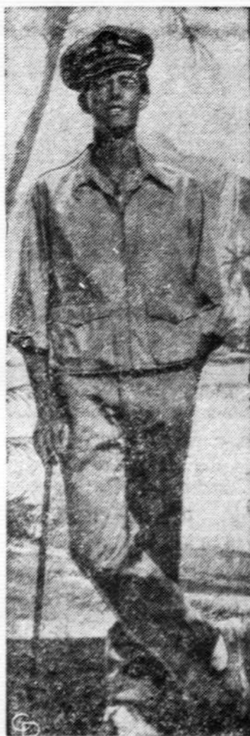
Peter Fonda vaidina J. F. Kennedy filme apie Kennedy „PT 109“. Fonda yra aktorius sūnus. Karo metu dabartinis prezidentas labai panašiai ir atrodė.