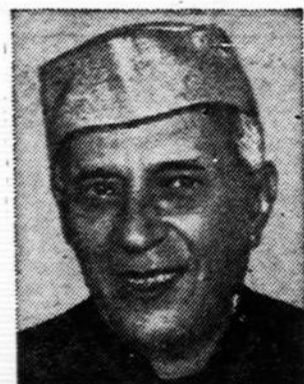
Indijos premjeras Nehru ruošiasi visuotiniams rinkimams, kurie bus šį mėnesį.

— Alžirijoje tebevyksta žudynės, pagrobimai ir vagystės. Tai vakar pranešė korespondentas iš Alžiro.