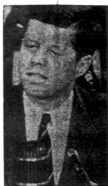
Prezidentas Kennedy pasiūlė naują ūkio planą.

— Detroito užvakar cirke žuvo du vaidintojų grupės nariai, atliekant ore žaidimus.