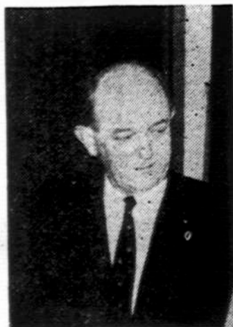
Valstybės sekretorius Rusk po OAS konferencijos Urugvajuje.

Kuba išjungta iš vakarų pusrutulio sistemos. Kas toliau?