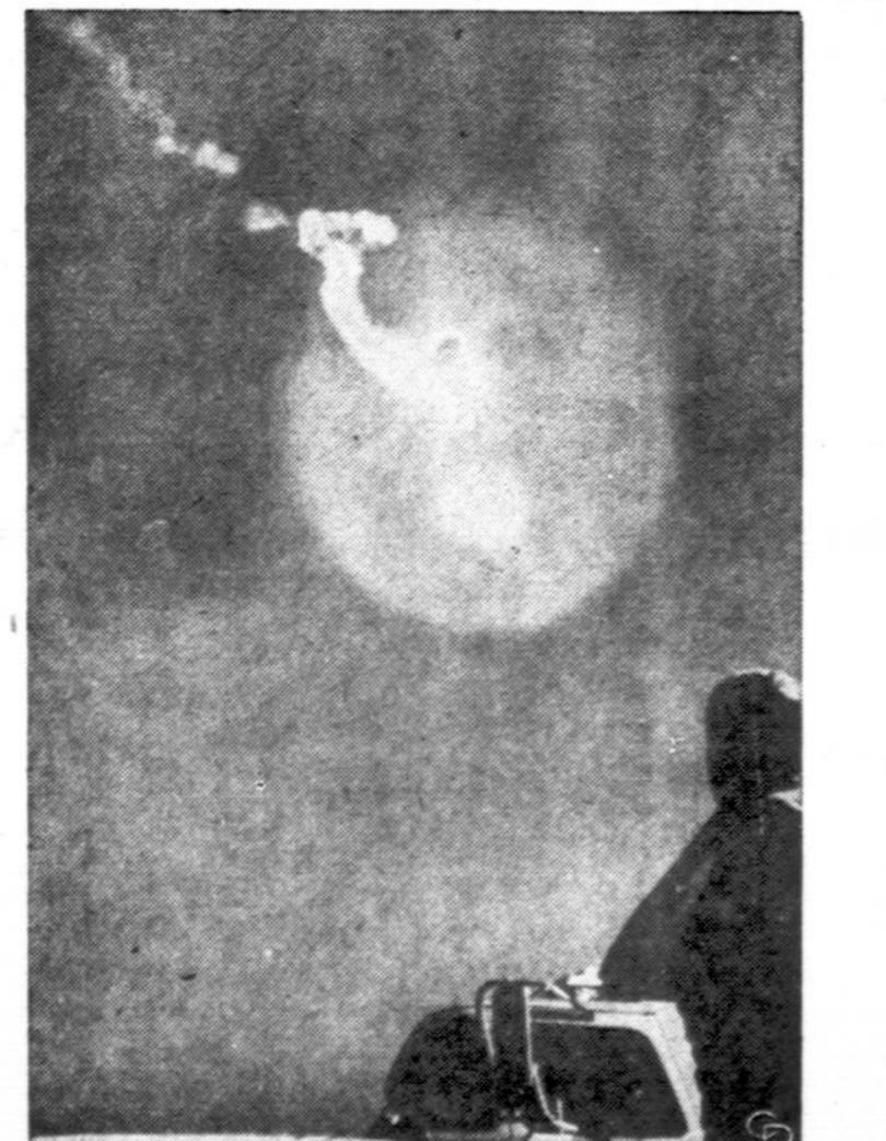
Paleidus Cape Canaveral, Fla., Titan I raketa, erdvėje matyti šviesa. Raketa pakilo 600 mylių aukštį ir nulėkė 5,000 mylių. Titan I ir Titan II raketos yra didesnės už Atlas raketa. Su Titan raketa buvo atlikta 47 bandymai.

Chicagoje yra 10,000 valgyklų bei restoranų, kuriuose dirba