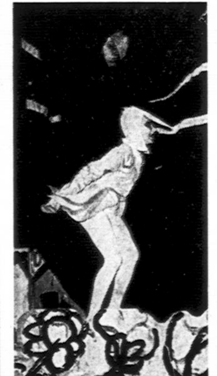
"Dvylikos brolių juodvarniais lakščiusių" Nykštukas — Rūta Nainytė

LRKSA 160 kp. metinis susirinkimas įvyko vasario 4 d. Dalyvavo 20 narių, nors galėjo dalyvauti žymiai daugiau. Ne-gausiom priežastimi galėjo būti ir supuolimas, kad tą pačią popietę buvo iškilmingas at-