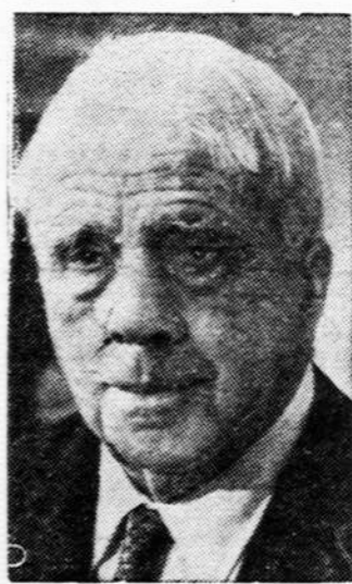
Poetas Robert Frost, 88 metų, buvo nuvežtas į Miami, Fla., ligoninę, kai pajuto plaučiuose spaudimą. Frost praleidžia kelias savaites Miami mieste kasmet.

Vokietijos Raudonasis Kryžius jau surado 305 angliakausius, kurie žuvo Saarbruecke, Vokietijoje, anglių kasyklose.