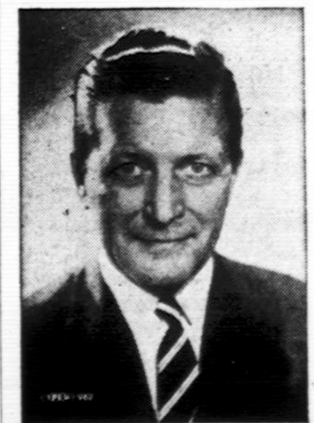
Kerner, Illinois gubernatorius

Alto pirmininkas praneša, kad delegacija susidės iš 21 asmens. Jon jeis Alto Vykdomojo komiteto keturi nariai, Lietuvių Bendruomenės šeši (keturi iš centro valdybos ir du iš LB Tarybos prezidento), Alto sudarančių grupių pirmininkai, Susivienijimų atstovai ir keli kiti. Vardai bus paskelbti vėliau.