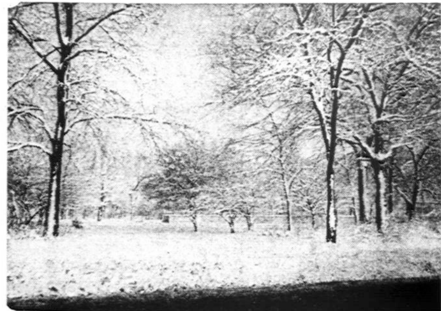
Saulė vis dar nepalaužia žiemos gražumo.

Dvi Chicagos kompanijos, U-nited Biscuit ir Schiltze & Birch Biscuit, iš JAV gynybos departamento Washington gavo už-sakymus iškepti 6,590,000 sva-ryų gyvybei palaikyti sausainių. Sausainiai skirti sukrovimui į apsaugas nuo atominių kritulių. Sausainiai kainuos $1,765,250.