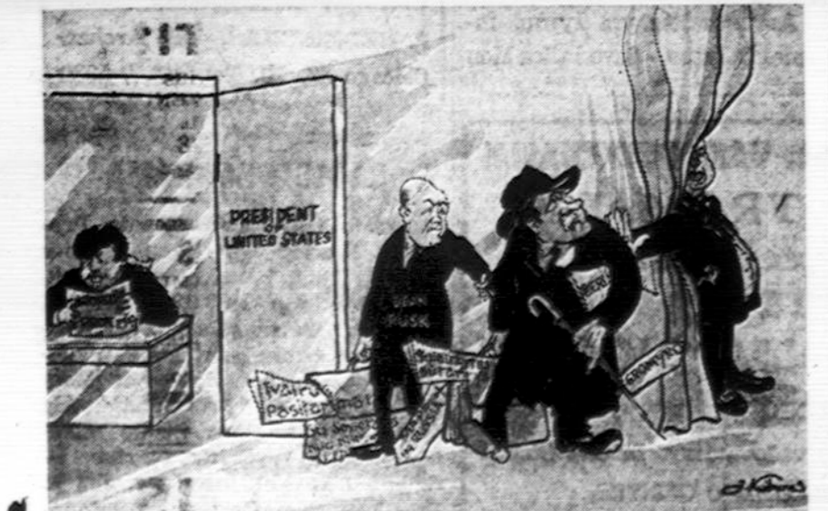
„Didieji“ projektuoja užsienių reikalų konferenciją Berlyno klausimu...