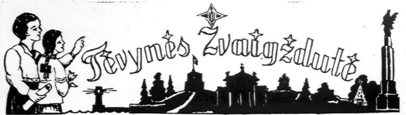
Redaguoja Lietuvos Mokytojų 5-gos Chicago sk. redakcinis kolektyvas Red. J. Plačas, red. pavad. M. Steikūnienė. Medžiagą siųsti: 7045 So. Claremont Ave., Chicago, Illinois