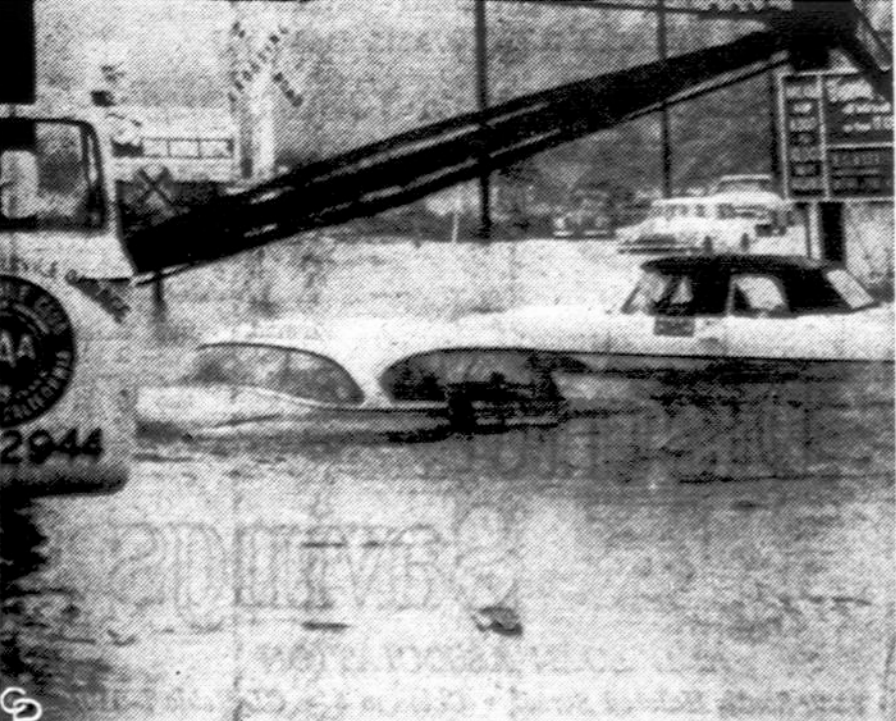
Californijoje, po atgražinio lietaus, kai kurios gatvės buvo užtvinę. Čia matyti viena gatvė Los Angeles, Calif., mieste.

Statybos ir Remontu Darbai 2618 WEST 71st STREET Tel. PR 8-4268 ir TE 9-553