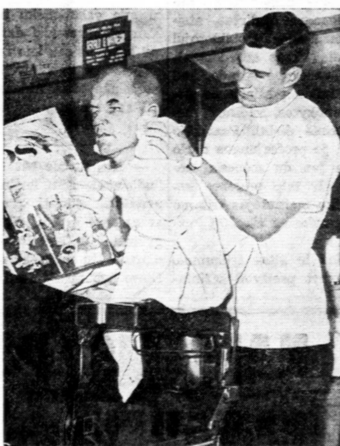
Astronautas Glenn skaito laikraštį kirpykloje, Cocoa Beach, Fla., besitarianant naujam terminui skristi apie žemę.

Meksikos sostinėje buvo suvažiavę to krašto vienuolynų vyresnieji ir, arkivyskupui Miguel Dario Mirando vadovaujant, studijavo enciklikos "Mater et Magistra" socialines mintis, kurios būtų panaudotinos visuomenės socialiniam auklėjimui.