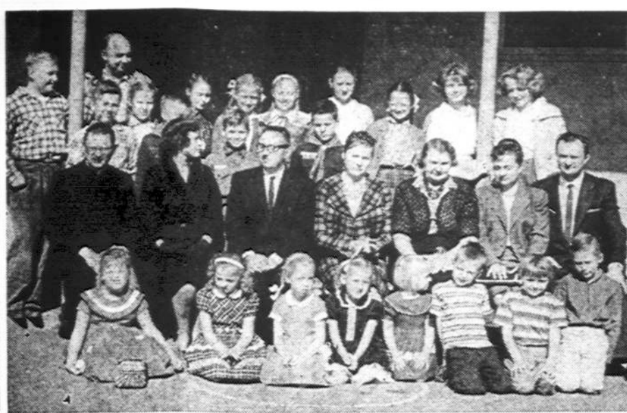
Los Angeles, Calif., šėštadienišės lituanistikos mokinių ir mokytojų grupė. (Nuotr. L. Kančausko).

Anglijoje 1840 m., Brazilijoje ir Šveicarijoje 1843 m., J. Amerikos Valst. 1847 m., Prancūzijoje, Bavarijoje ir Belgijoje 1849 m., Ispanijoje ir Prūsijoje 1850 m., Viurtemburge ir Danijoje 1851 m., Liuksemburge 1852 m., Portugalijoje 1853 m., Švedijoje ir Norvegijoje 1855 m., Meksikoje 1856 m., Rusijoje 1857 m., Argentinoje 1858 m., Kanadoje 1859 m., Graikijoje ir Italijoje 1861 m., Turkijoje 1863 m., Egipte 1866 m., Japonijoje 1871 m., Kinijoje 1878 m.