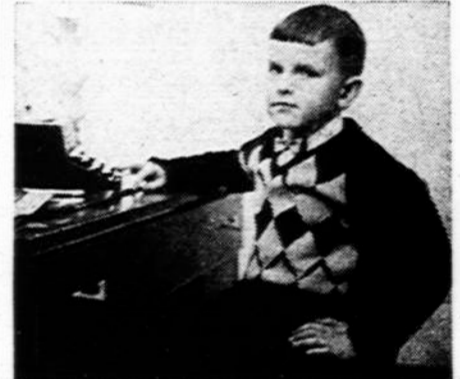
Ruošiuosi būti laikraštinku.

Kad ant ledo ir sugrūnam Ir nosytės raudonuoja. Niekad šalta mums nebūna. Visi šaukiam: "Valio žiema!" Rūtėlė Mikolajūnaitė