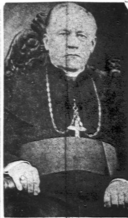
Vysk. T. Matulionis — arkivyskupas

— Prastos oro sąlygos gali sutrukdyti šiandien astronauto John Glenn skridimą aplink žemę.