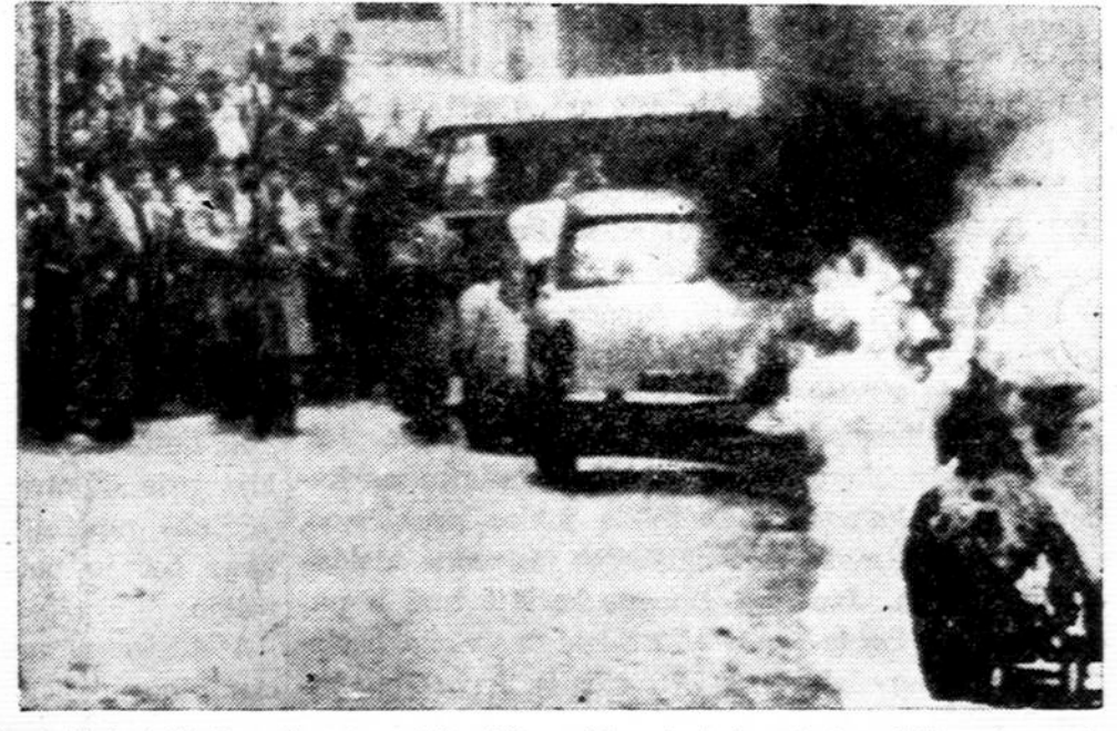
Kareiviai ir civiliai stebi degantį automobilį Alžiro vidurmiestyje. Automobilį padegė slaptosios kariuomenės organizacijos vyras. Prancūzų saugumiečiai areštavo 21 įtartinį slaptosios kariuomenės organizacijos narį.

Bylos parodo dar vieną dalyką: spaudimas daromas ne tiek spekuliantams, kiek katalikams bei žydams. "New York Times" neseniai rašė, kad spekuliacija vyko visoje Sovietų Sąjungoje su pilna policijos žinia. Užnugaryje, be abejo, yra daug stambesnių žuvų. Jų niekas nedrįsta judinti, bet dėmesį reikia kur nors nukreipti nuo jų. Čia ir praverčia Lietuvos kunigai bei žydai. N.