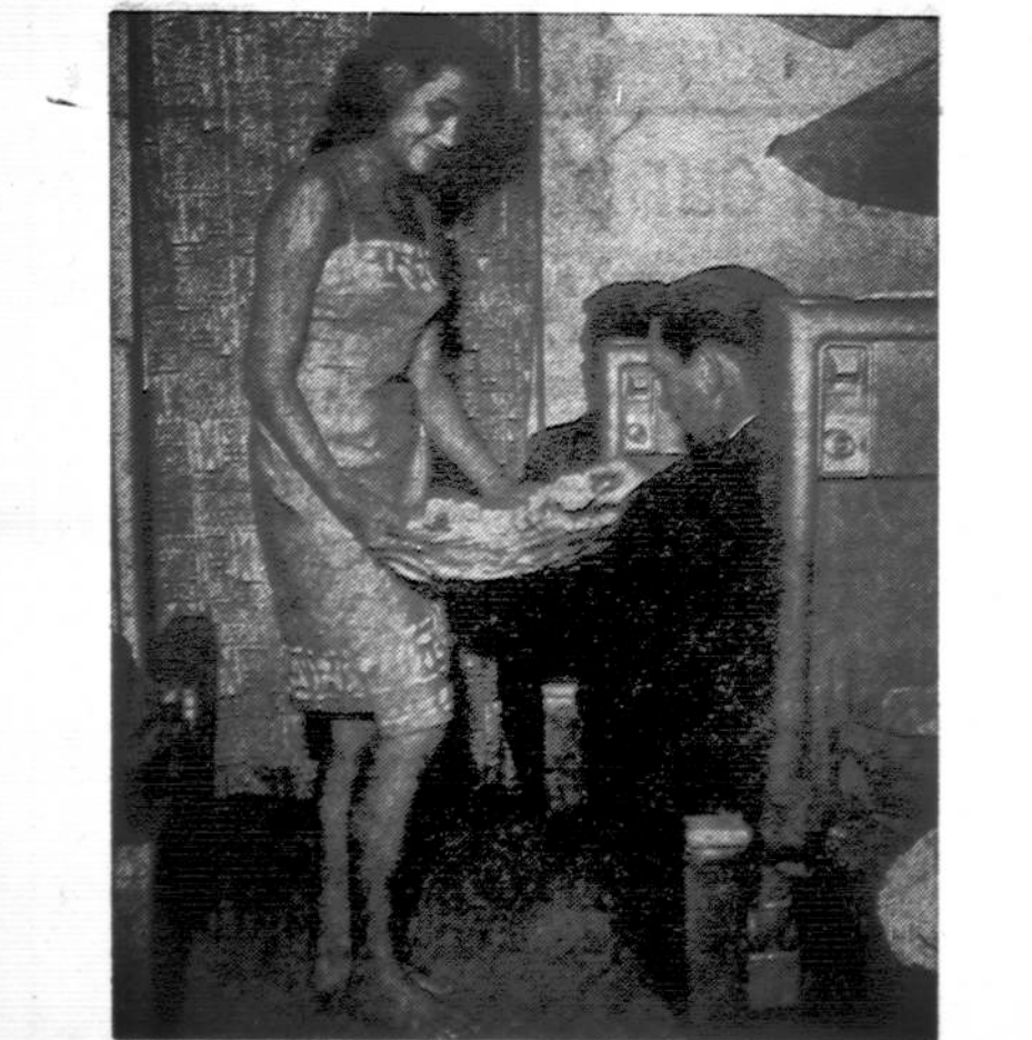
Šitai apsiręngusi lėktuvo patarnautoja Sanquer aptarnauja keleivius, skrendančius iš JAV į Tahiti, prancūzų lėktuvų linijos TAI lėktuvais.

Statybos ir Remonto Darbai 2618 WEST 71st STREET Tel. PR 8-4268 ir TE 9-5532