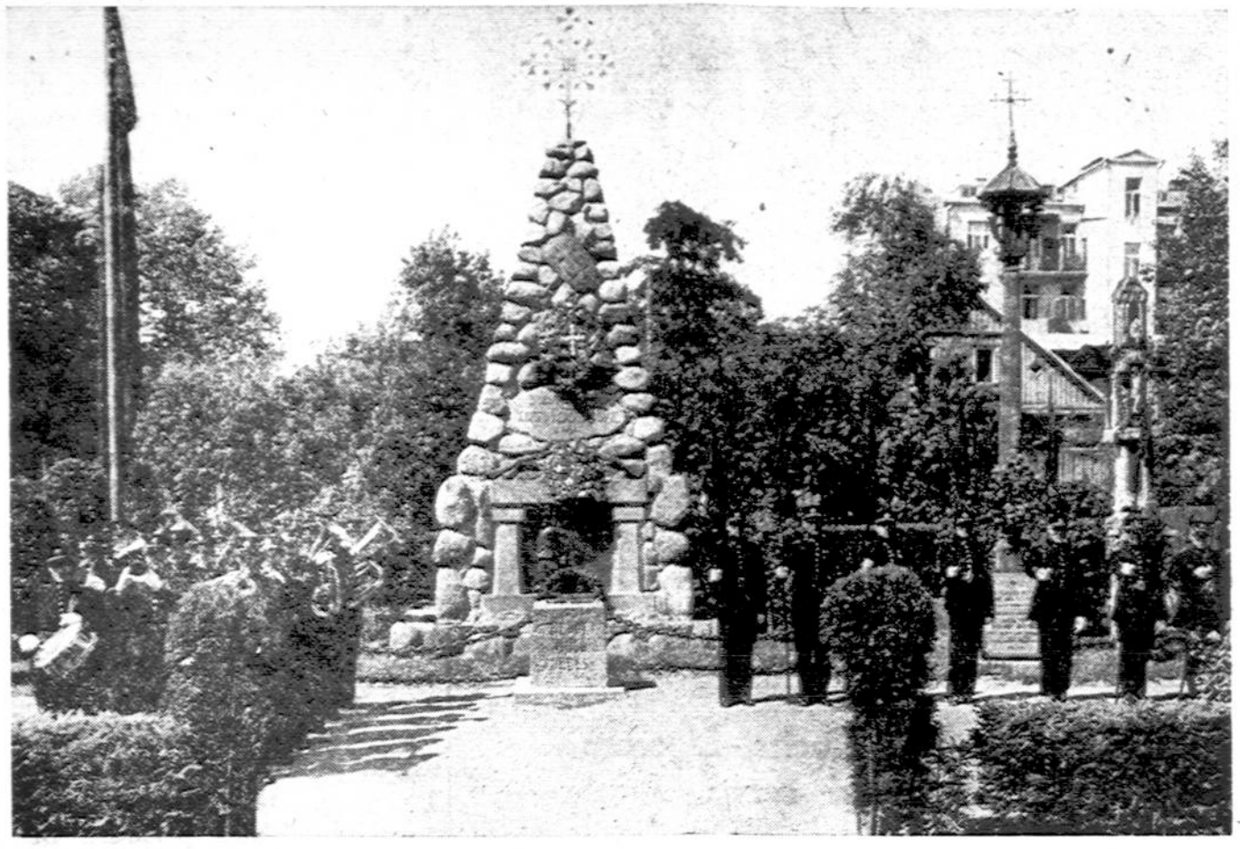
Paminklas žuvusiems už Lietuvos laisvę primena mūsų įsipareigojimus tautai