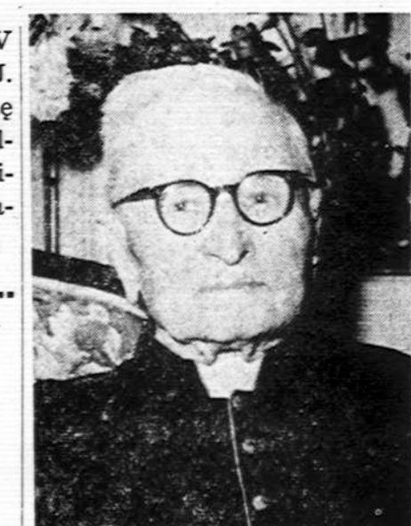
Prel. K. Saulys, Lietuvos nepriklausomybės atkūrimo signataras

— Astronautas John Glenn, jei tik bus palankus oras, šiandien skris raketosje aplink žemę. Bet greičiausiai, kad jo skridimas bus atidėtas sekančią savaitę.