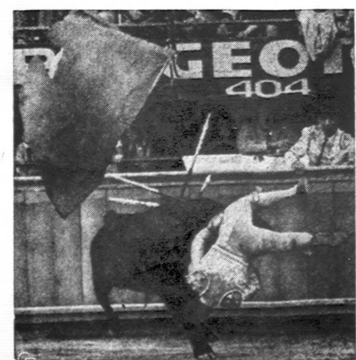
Mexico City bulių kautynėse žaidėjui nepavyko, tačiau ir nelabai blogai baigėsi, nes iš po jaučio ragų išliko gyvas, gavęs keletą nemirtinų sužalojimų.