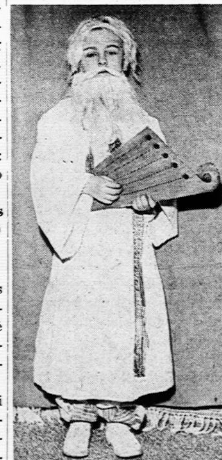
Vaidyla — L. Degutis. Kaukė laimėjusi premiją vaikų kaukių balijuje.

Ne tiek įkando, kiek išsigando. Dreba, kaip epušės lapelis.