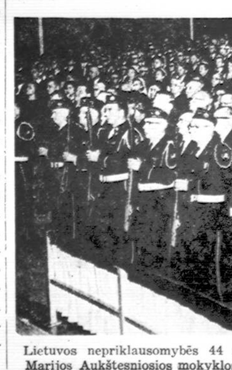
Lietuvos nepriklausomybės 44 metų atkūrimo sukakties iškilmingo minėjimo dalyviai Chicagoje Marijos Aukštesniosios mokyklos salėje vasario 18 d., giedant Lietuvos himną.