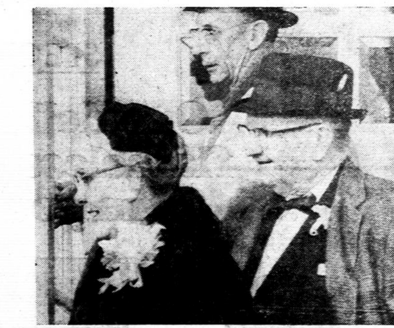
Astronauto tėvai išėina iš savo namų, kai buvo paskelbta, kad sūnus laimingai grįžo į žemę. Jie džiaugiasi, kad jų maldos išklausytos ir sūnaus kelionė erdvėmis gerai pavyko.

Statistiniuose duomenyse nurodoma, jog visose mokyklose, įskaitant ir aukštąsias mokyklas, besimokančiųjų skaičius esąs 542,000. Iš to skaičiaus 74,000 besimokantieji dirba įvairiose darbo srityse. Tai žymiai daugiau, negu kad besimokančiųjų buvo įjungta į darbą 1960 metais. Tatai rodo, kad baudžiavinis pareigijimas besimokant kartu dirbti vis daugiau plečiamas.