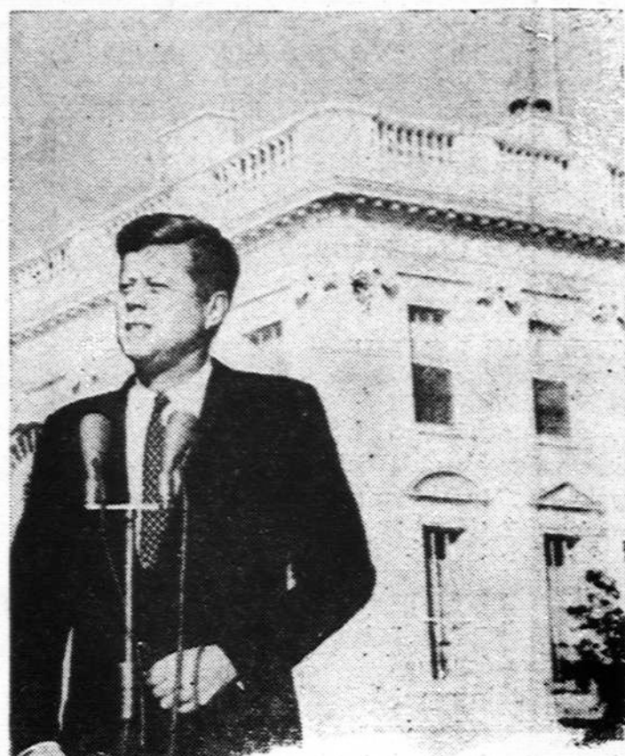
Prezidentas Kennedy pasveikino astronautą John Glenn, kai jis antradienį apskrido raketą tris kartus aplink žemę. Rytoj JAV prezidentas susitiks Cape Canaveral, Fla., bazėje.