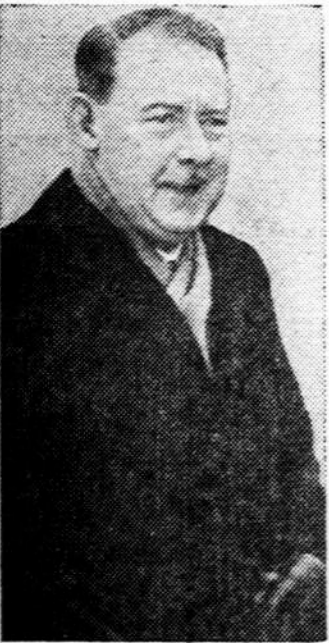
Britų darbo partijos vadas Gaitskell lankėsi Washingtono ir iš ten išvyksta į Bermudą.

PAKELIAMI TILTAI GAISI-NA LAIKĄ Chicagoje 55 pakeliami ar atidromi tiltai skersai kanalą ir dvi upes pernai didesnių laivų praleidimui prasivėrė 39,904 kartus. Vaziuojantiems ir pėsčiams reikėjo palaukti 3,911 valandų.