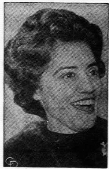
Astronauto Glenn žmona neslepia džiaugsmo, kad vyras laimingai atliko kelionę apie žemę.

Administracinis namas yra tiek pat reikalingas kaip ir pati salė stovyklai. Stovyklą statant salės pastatas ir miegamieji namai buvo pirmo reikalingumo sąlyga pradėti stovyklavimą, gi administracijos namo statyba buvo palikta vėlesniam laikui dėl lėšų trūkumo ir jo reikalingumo išbandymui. Bandomas laikas po penkmečio stovyklos gyvenimo rodo, kad stovyklautojų skaičius kasmet didėja, o su jų skaičiumi auga ir reikalavimai. Šis pastatas tarnautų stovyklautojų darbo programom: raštinei, įvairiems rankų darbų užsiėmimams, sporto įrankiams (stalo tenisui, šachmatams ir kt.), knygynui ir pagaliau būtent kambarys ir stovyklos kapelionui, kuriam iki šiol tenka gyventi labai nepavydėtinoje sąlygoje — kaimynystėje dieną naktį užiančio valgyklos šaldytuvo ir vandens tankų burzgiu. Dabartinėse sąlygose, ypačingai blogam orui esant (o jų pasitaiko), ir vadovai ir stovyklautojai susiduria su didele problema, kaip suderinti vienoje salėje dainavimą atskirų būrelių su vykstančiomis pamokomis ir pasiruošimais vakarų programom. Taigi šis pastatas išspręstų daug reikalų, o darbas būtų dar našesnis.