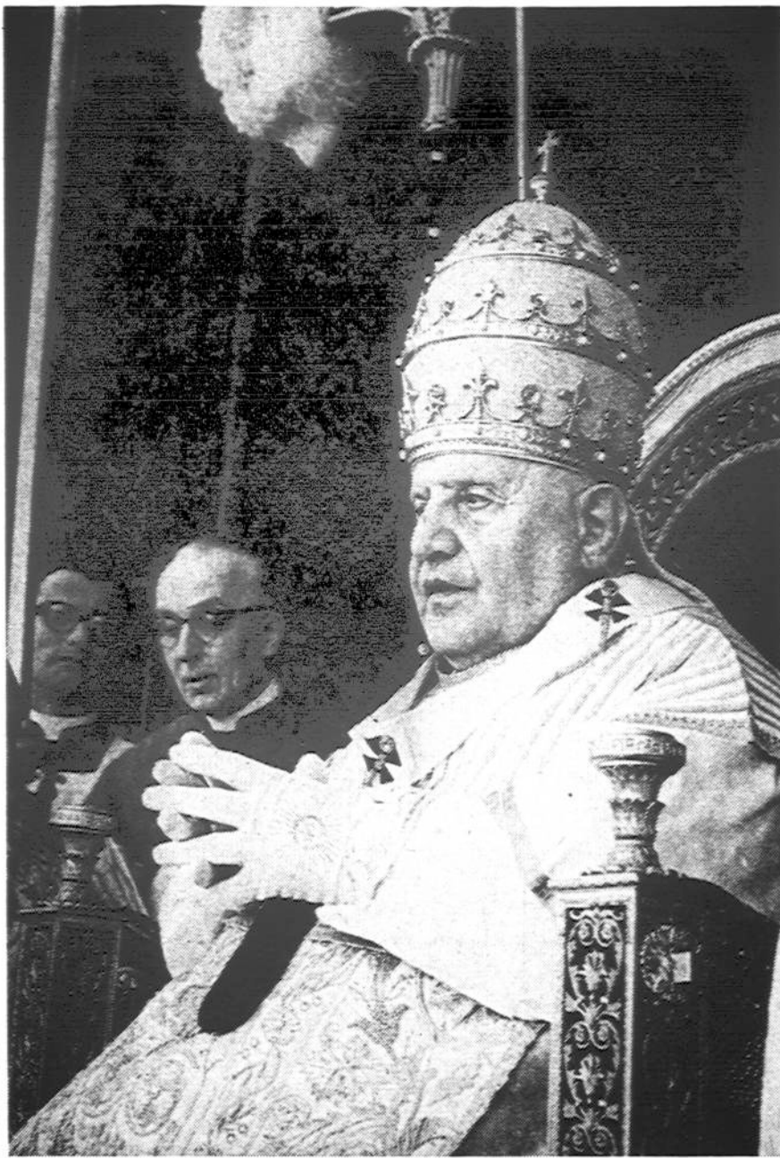
Sv. Tėvas Jonas XXIII Bažnyčios vadovo poste

chai, primai, arkivyskupai ir vado Konstancos visuot. susirinkime Vytauto Didžiojo pasiūsta. Krikščionių vienybė Visa eilė visuot. B-čios susirinkimų praityje svarstė krikščionių vienybės klausimą, bet vis be pasekmių. Šis šaukiamasis visuot. susirinkimas gal labiausiai ir pagarsėjo pasaulyje šiuo vienybės klausimu. Taip šiame susirinkime, aišku, bus svarstomas ir šis klausimas, bet tuo tarpu daug vilčių dėti niekas nedrįsta. Viena betgi yra tikra, kad, jeigu