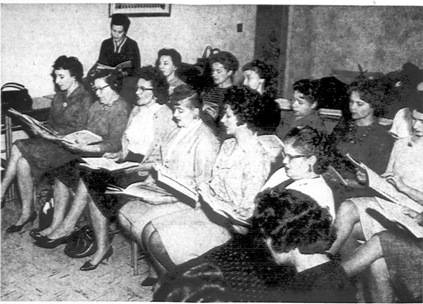
Chicagos Lietuvių Operos moterų choras įtemptai ruošiasi "Aidos" operai, kuri bus balandžio mėn. Nuotraukoje dalis moterų choro repeticijos metu. Repeticiją veda chormeisterė Alice Stephens, kurios čia nematyti.

1) vasario 16 dienos laidoje turėjo būti: "...smuikininkas-virtuozas..." 2) Vasario 17 dienos laidoje turėjo būti: Varpininkų Filisterių draugija... (Pr.)