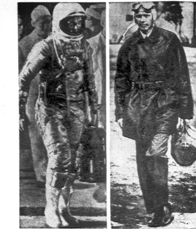
Prieš 35 m. buvo didelis įvykis, kai C. A. Lindbergh (dešinė) perskrido Atlantą. Tačiau J. H. Glenn skridimas apie žemę yra daug reikšmingesnis.

Amerikos Lietuvių Balso Radijo klubo valdyba pakvietė visiems Detroito lietuviams pažį-