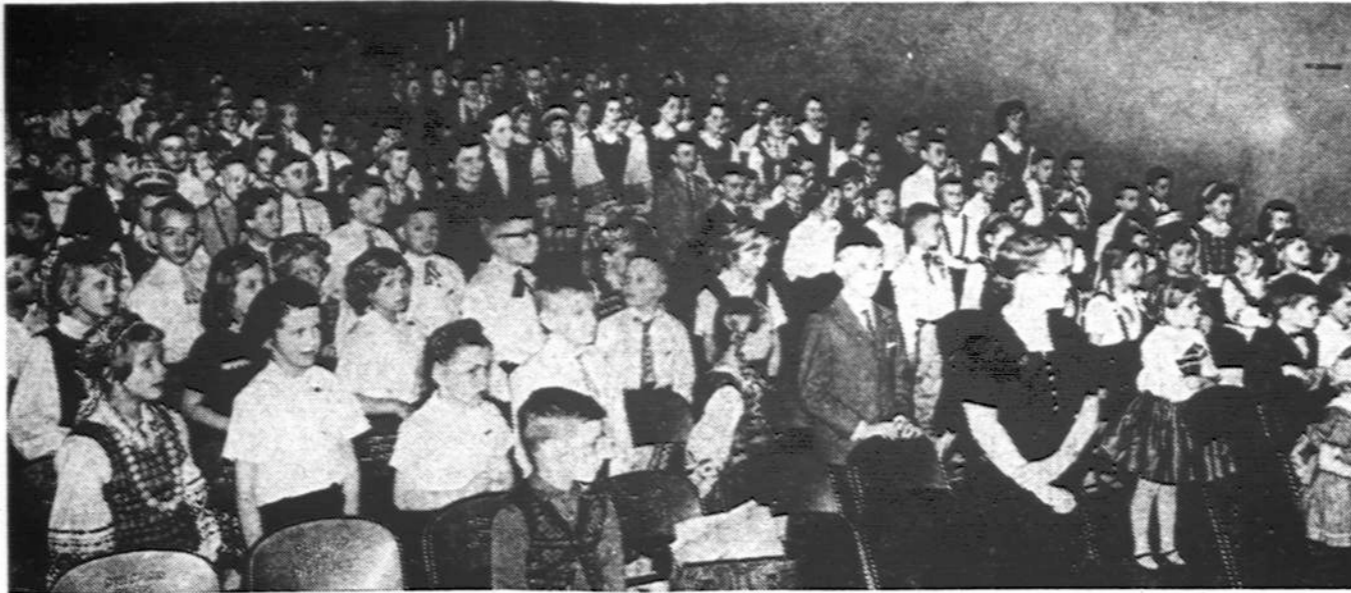
Nepriklausomybės šventę minėjo Donelaičio liuanistinės mokyklos mokiniai vasario 25 d. Jaunimo Centre, Chicagoje. Ta proga Vasario 16 gimnazijai, Vokietijoje, per A. Gulbinską mokiniai įteikė 200 dolerių. Nuotrauka A. Gulbinsko

— Guikiai. Geriau, kaip tikėjomės. Stambūs JAV visuomenininkai, žinomi visai šaliai, įsijungė į K - L rezolucijos garbės ar patariamąjį komitetus. Jų vardai plačiai nuskambėjo ir mūsų spaudoje. Jų tarpe yra stambių abiejų partijų asmenų. K - L rezolucijai remti judėjimas gali pasidaryti labai populiarus Amerikos visuomeniniame ir politiniame lauke. Turime gerų vyrų ir gerų rašinių stambioje spaudoje. Tačiau į visa