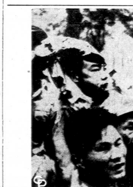
Saigone, Pietų Vietname, po bombardavimo — Džype vežami sužeisti ir ligoninė, išdėvinkami pilotams iš kovos lėktuvų numetus bombas ir prezidento rūmams. Keturi asmenys žuvo ir 10 buvo sužeista.

Nors anksčiau buvo kiek nuogastavimų, ar 700 dalyvių talpinanti Mozarto salė Dainų halėje sutraukus daugiau dalyvių, bet, kaip pasirodė, jų atsirado ligi pusės tūkstančio ir jų daugiau.