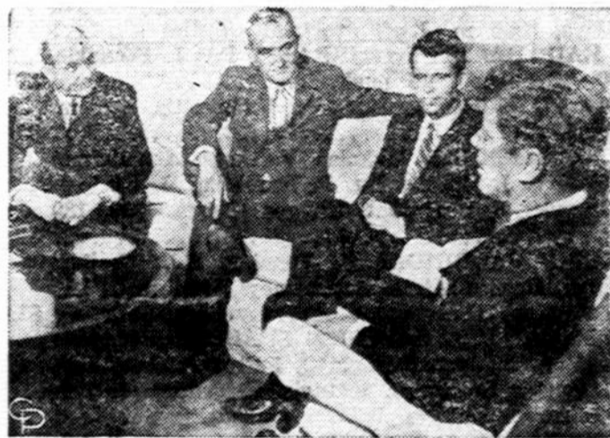
Baltose Rūmuose gen. prokur. Robert Kennedy kalba apie savo geros valios kelionę per pasaulį. Konferencijoje dalyvauja (iš k. į deš.) valst. sekret. Rusk, viceprez. Johnson, Robert Kennedy ir prezidentas Kennedy.