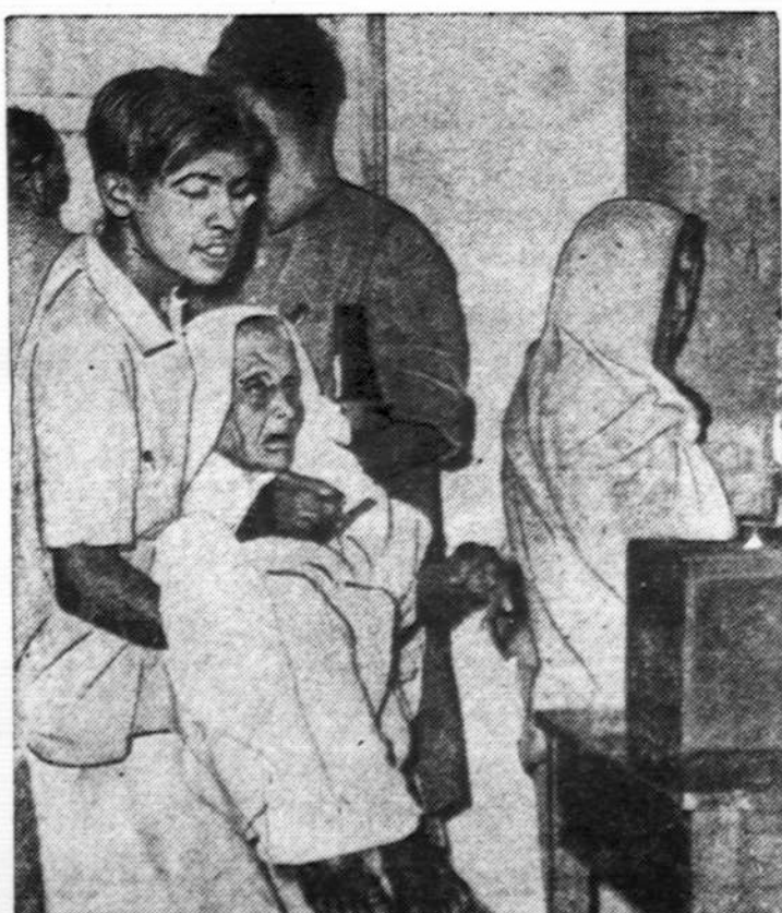
Indijoje neseniai įvyko balsavimai. Nuotraukoj matyti seniausia balsuotoja, 105 m. Balsai bus suskaičiuoti savaitės laikotarpy, tačiau aišku, kad laimėjo valdancioji Nehru partija.

VATIKANAS — Popiežius Jonas XXIII lydymas policijos, užvakar išvyko iš Vatikano ir aplankė Laterano seminariją, kur jis buvo klierikas.