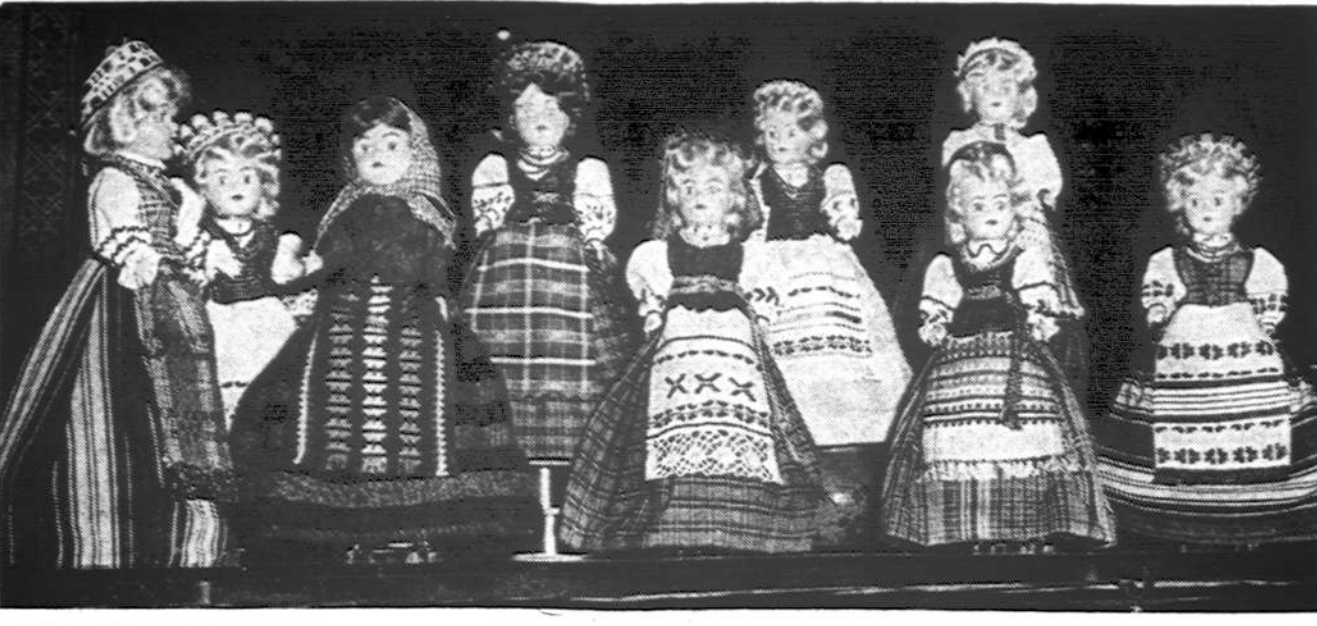
Lietuviškos lėlės